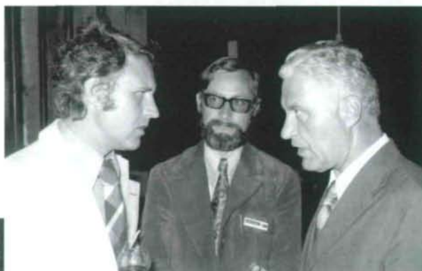
1. Vor dem Symposium