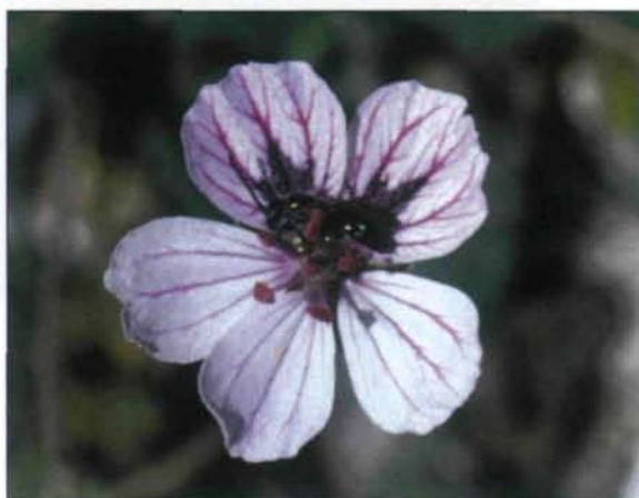
Abb. 5: Erodium petraeum (potenzielle Futterpflanze von S. aistleitneri ), 9.7.2000, Sierra Arana, 2000 m.

auf, mit der der Weg abgesperrt war. Doch die Mühe war vergebens, nicht ein S. aistleitneri -Exemplar bekamen wir noch zu Gesicht.