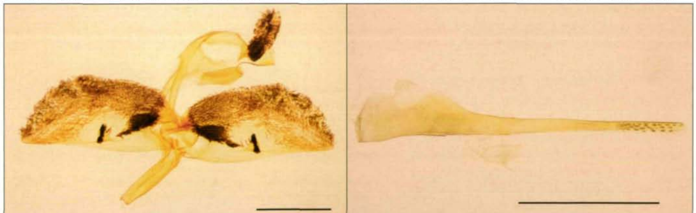
Abb. 1: S. aistleitneri ♂, Spanien, Prov. Granada, Sierra Arana, 2000 m, 9.7.2000, leg. Pühringer & Pöll (a Genitale; b. Aedoeagus; Messbalken: 1 mm)

Aus dieser Liste suchten wir dann einen Berg aus, der mit dem Auto relativ gut erreichbar schien. Unsere Wahl fiel auf die Sierra Arana, 25 km nördlich der Sierra Nevada, aber mehr als 100 km von der Sierra de Guillimona entfernt. Die Anfahrt mit dem Auto (vom Norden