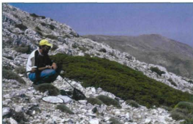
Abb. 4: Biotop von S. aistleitneri , 9.7.2000, Sierra Arana, 2000 m.

her) am 9.7. war eher ein Albtraum, 15 km über erbärmliche Straßen, einmal sind wir aufgesessen. Als wir am Ziel angekommen waren, stellten wir fest, dass mittlerweile von Süden her eine hervorragend befahrbare Straße auf die Arana gebaut worden war, die in unserer Karte aber noch nicht eingezeichnet war. Wir waren aber trotzdem froh, nicht mehr denselben Weg zurückfahren zu müssen. Nach Überwindung der letzten 300 Höhenmeter zu Fuß fanden wir insbesondere im unmittelbaren Gipfelbereich eine relativ starke Population von Erodium petraeum vor (Abb. 5). Der Pheromonfang im Bereich des Gipfelplateaus – abseits des unmittelbaren Gipfelbereichs (Abb. 4) – erbrachte (wiederum am BASF-Pheromon) 30♂ von S. aistleitneri , 2 davon frisch (Abb. 3). Die Suche nach Fraßspuren in den Wurzelstöcken von Erodium und 2 Helianthemum -Arten blieb aber wieder erfolglos. Armeria sahen wir auf der Sierra Arana nicht.