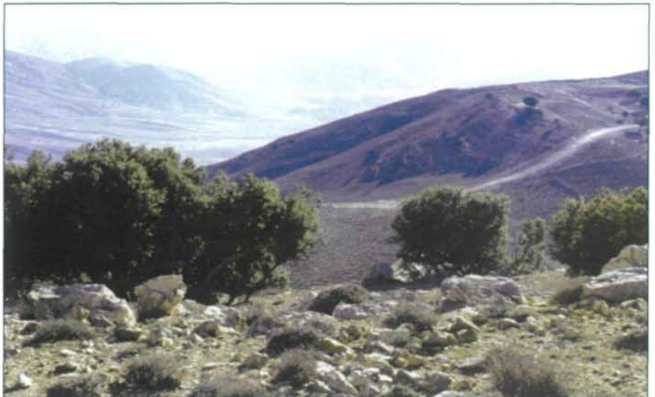
Abb. 9: Das südliche Bergland stellt eine bedeutende Klimagrenze dar. Die hartlaubige mediterrane Waldvegetation ( Quercus calliprinos ) erreicht hier ihre Südgrenze und verzahnt sich mit Kleinstrauchgesellschaften der Steppe ( Artemisia herba alba ).