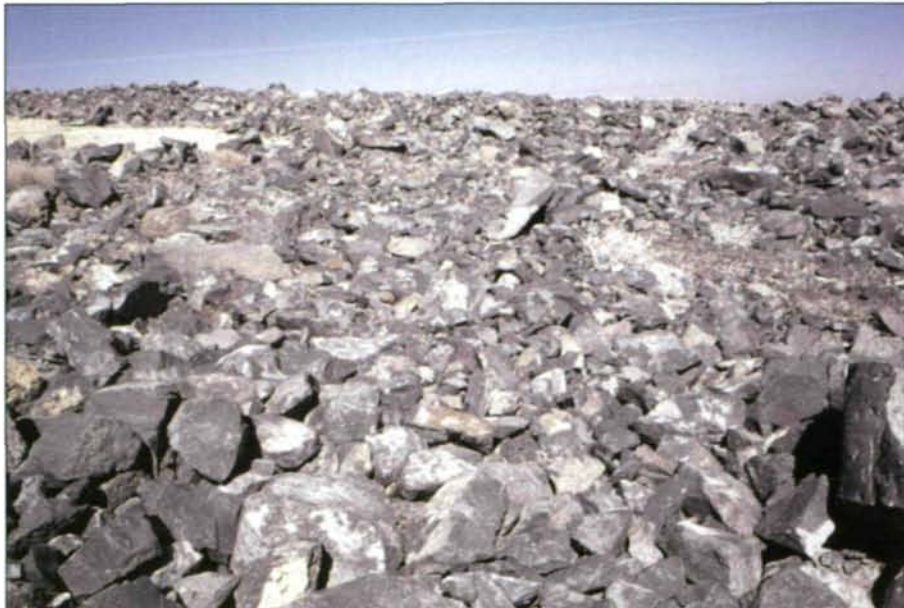
Abb. 2: Monoton erstreckt sich die östliche Basaltwüste („Harra“) nahe der syrischen Grenze. Die Steine tragen helle Überzüge durch genügsame Krustenflechten.

Meer und im östlichen Hochland. Nur 8270 km 2 , also weniger als 10 % der Bodenfläche Jordaniens, werden in diesen klimatisch begünstigten Gebieten landwirtschaftlich sehr intensiv genutzt, oft mehr als für Boden, Grund- und Oberflächenwasser verträglich ist, leider auch mit steigendem Pestizideinsatz. Die umfangreichen und gut ausgebauten Bewässerungsanlagen im Bereich des Ghor-Projektes (Tiefeland östlich des Jordan von East Ghor) bzw. Staudämme (King-Dalal-Damm, Maqarin-Damm und andere) ermöglichen gemeinsam mit dem Wasser des Jordan ausgedehnte Gemüse- und Obstkulturen, während sich das mediterrane Übergangsklima im Nordosten (Hügelland von Ajlun) vorwiegend für Olivenpflanzungen eignet. Noch weiter östlich im Einflussbereich des kontinental geprägten Steppenklimas (Plateaulandschaft um Mafraq) wird Wintergetreide im Regenfeldbau großflächig gepflanzt. Die trockeneren Produktionsflächen des östlichen Hochlandes sind jedoch durch das ausgeprägte Niederschlagsgefälle von Westen nach Osten zu über 90 % stark regenabhängig und weisen daher schwankende Produktionsziffern auf. Etwa ein Drittel der Agrarproduktion entfällt auf die Viehhaltung – hauptsächlich Schafe und Ziegen, z. T. auch Kamele – von Nomaden, die in den für Ackerbau bereits ungeeigneten Landesteilen noch gewinnträchtig ist (WAITZBAUER 1995).