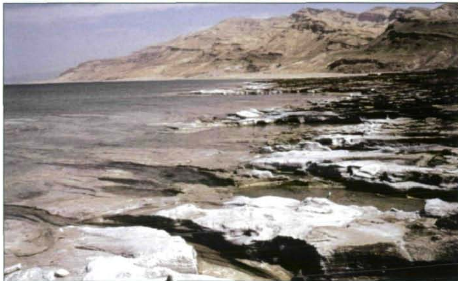
Abb. 6: Blick auf das tiefe Nordbecken des Toten Meeres mit dem östlichen Randgebirge.

Die Senke des Wadi Araba-Totes Meer-Jordan Graben zwischen dem Golf von Aqaba und dem See Tiberias (See Genezareth) im Grenzgebiet zwischen dem Libanon und Syrien bildet ein rund 360 km langes und 8 bis knapp 18 km breites Teilstück einer von Ostafrika über 6000 km Länge bis nach Nordsyrien verlaufenden Bruchzone. Sie ist geologisch jung und stammt aus dem frühen Tertiär – vermutlich dem Oligozän. Den zentralen Teil der Grabenstruktur nimmt das in zwei Becken geteilte Tote Meer ein. Es liegt heute etwa 411 m unter dem Meeressniveau und ist damit die tiefste Landsenke der Erde (vgl. Kap. Geologie/Wadi Araba-Jordangraben) (Abb. 6). Diese trennt zugleich das Wadi Araba , die 180 km lange Verbindung zum Golf von Aqaba vom 105 km langen Jordantal im Norden (Abb. 7).