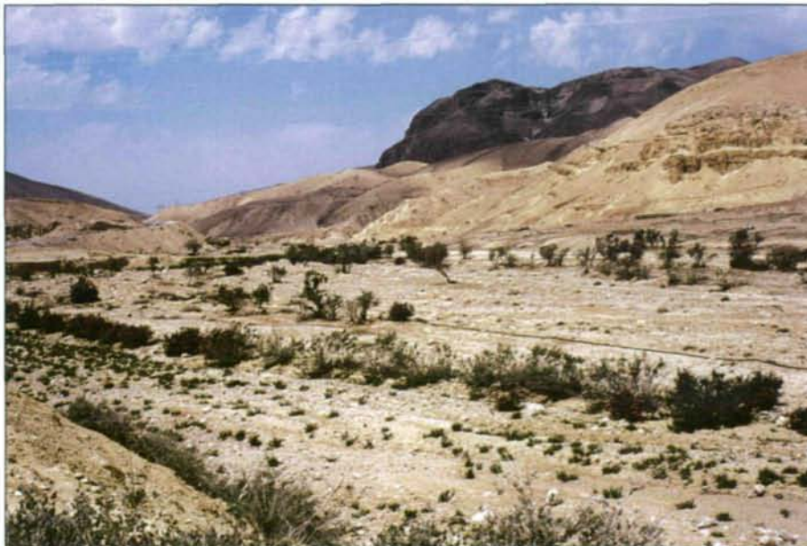
Abb. 12: Oleanderbüsche markieren den Verlauf des schon im Frühjahr weitgehend ausgetrockneten Wadi Hesa.

Im Norden sind es Yarmuk, das Wadi Arab (nicht zu verwechseln mit dem Wadi Araba, dem südlichen Abschnitt des jordanischen Grabenbruches) und der Zarqa. Nach Süden folgt das Wadi Shueib, das nach seiner Mündung im Jordantal als Wadi Nimrin bekannt ist. Das Wadi es-Sir verbindet sich bei Wadi Kufrein mit dem Wadi Naur zum Wadi En-Nusariyat und entwässert in das Jordantal. Südlich von Amman entspringt das Wadi Zerqa Ma'in bei den Thermalquellen von Ain ez-Zarqa, entwässert die Berge südwestlich der Stadt Madaba und mündet – wie das südlichere Wadi Wala und Hesa – in das Tote Meer. Das Wadi el-Mujib ist der größte Fluss Jordaniens, ein mächtiger Durchbruchscanon, der, wie auch die südlich davon gelegenen Widyan Kerak und el-Hesa (Hasa), in das Tote Meer mündet. Zum Wadi Araba entwässern unter anderen das Wadi Dana und das Wadi Musa.