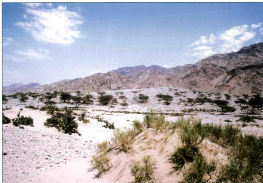
Abb. 7: Das Wadi Araba bildet die knapp 200 km lange Südverbindung zwischen dem Toten Meer und dem Golf von Aqaba. Akazien auf den Schotterfächern pleistozäner Flüsse am Fuß des Grabengebirges verweisen auf den afrikanischen Einfluss, welcher hier seine nördliche Grenze erreicht.

Das Jordantal (Abb. 8) und die klimatisch begünstigte grüne Hügellandschaft im Nordwesten des Landes waren bereits in neolithischer Zeit bewohnt. Die Geschichte Jerichos im westlichen Jordantal reicht bis in das 8./9. Jahrtausend v. Chr. zurück, sie gilt damit als älteste Stadt der Welt. Die