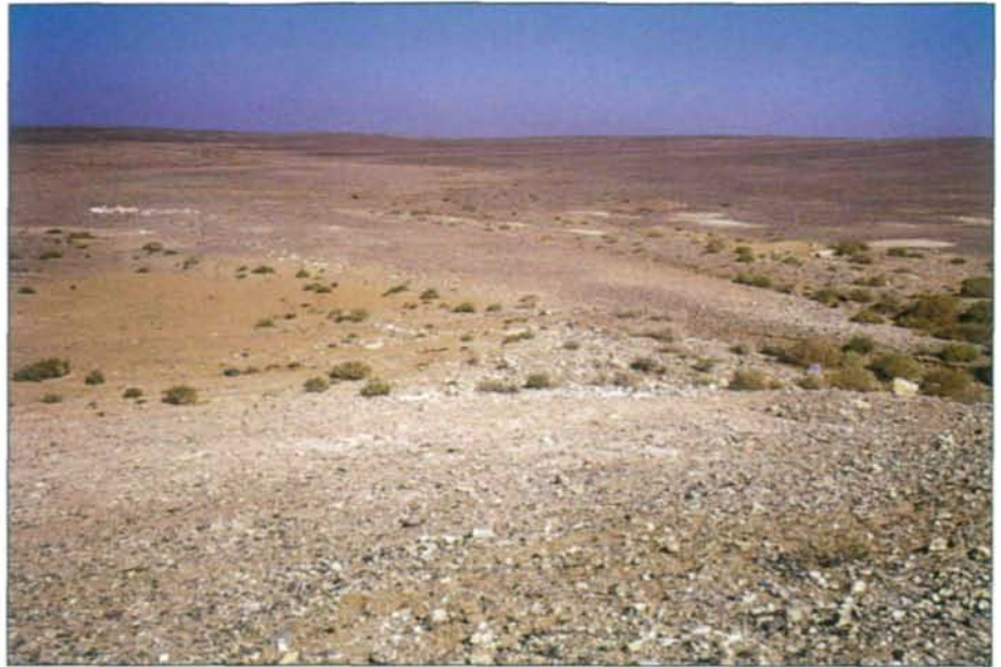
Abb. 3: Blick in die Senke des Wadi Sirhan im Grenzgebiet zwischen Syrien, Jordanien und Saudi Arabien. Man beachte die kontrahierte Vegetation im kleinen Wadi.

Das Wadi as-Sirhan ist eine Nordwest-Südost gerichtete Senke von 300 km Länge und 30-50 km Breite und erstreckt sich von ihrem nördlichen Ende zwischen der Oase von Azraq im Osten Jordaniens bis weit nach Saudi Arabien (Abb. 3). Bereits die neolithischen Jäger folgten hier dem Zug der Wildtiere und von alters her war diese große, die Winterniederschläge sammelnde Depression stets traditionelles Weideland der Nomaden auf ihren Wanderzügen, die nun