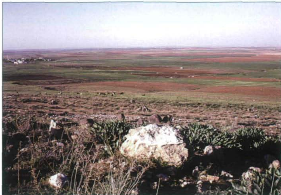
Abb. 13: Weite, intensiv bewirtschaftete Terra rossa-Böden kennzeichnen die flache Agrarlandschaft des zentralen Kalkplateaus zwischen Madaba und Kerak. Neben dem Felsbrocken wächst die Meerzwiebel, Urginae maritima .

Jordanien's Landesfläche von etwa 89.000 km 2 verfügt über eine große Vielfalt unterschiedlicher Landschaften in rasch wechselnder Abfolge mit einem scharfen Gradienten von Norden nach Süden und von Westen nach Osten als Folge klimatischer und geologischer Bedingungen. Im Norden erstreckt sich eine mediterran geprägte wellige Hügellandschaft mit Kulturlandschaften aus Oliven-, Obstbäumen und Weizenfeldern, aber auch Restbeständen natürlicher Vegetation – Kiefernwälder und Eichenmacchies. Tiefe Täler führen nach Westen in das weite Jordantal, welches ein Teil des syrisch-afrikanischen Grabenbruchs ist. Das geologisch bedeutende Riftsystem bildet die Westgrenze Jordanien's und schließt im Norden den Jordan ein, der nach 105 km in das Tote Meer fließt. Dieses liegt 411 m unterhalb des Meeresspiegels und ist somit der tiefste Punkt der Erde. Auf seiner Ostseite führt ein zerklüftetes Randgebirge aus Höhen bis zu 1727 m steil in den Graben hinab. In tiefen Canons entwässern mächtige Wadis, die sich in etlichen 10.000en Jahren durch die schroffen Hänge in die Depression des Toten Meeres gegraben haben. Von dessen Südrand bis Aqaba erstreckt sich das heiße und weite Wadi Araba über 200 km lang bis nach Aqaba, dem einzigen Zugang zum Roten Meer. Der gebirgige Südteil und die flachen östlichen Plateaus haben Wüstencharakter. Wüsten und trockene Steppen-