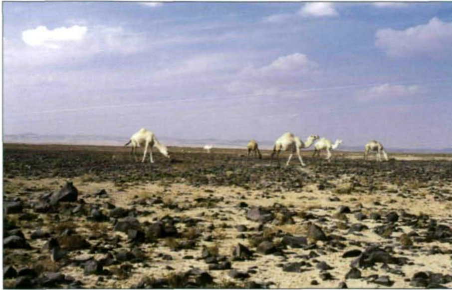
Abb. 5: Karge Nomadenweiden und Menschenleere prägen das Bild im südlichen Teil der Badia.

nigsten besiedelte Großlandschaft, praktisch menschenleer und nur von Nomaden durchzogen (Abb. 5).