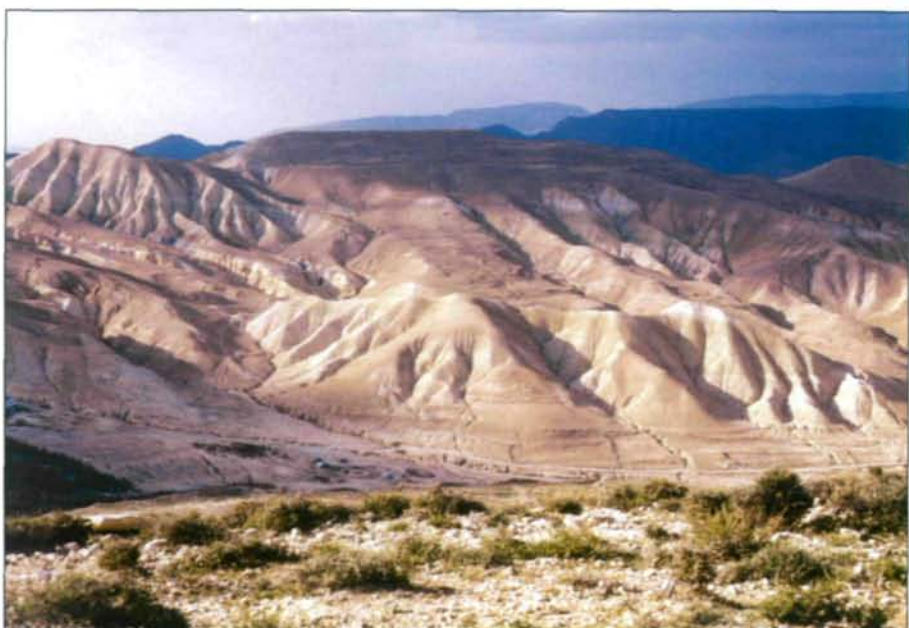
Abb. 14: Extreme Degradierung durch Überweidung und Erosion ist für den südlichen Bereich des Kalkplateaus typisch. Wälder wurden hier zur Wüste. Abhänge zum Tal des Wadi el-Hesa.

landschaften bedecken zwar 85-88 % der Landesfläche, doch sind sie recht vielgestaltig, wie etwa die phantastische Kulisse der Sandsteinberge und sandigen Täler des Wadi Rum, die unterschiedlichen Typen der steinigen Hamadas, wie die weite Horn-(Flint)stein-Wüste im Osten oder die vulkanische Harra in der Badia, die zur Syrischen Wüste gehört. Eine besondere wüstenhafte Landschaft stellt die salzige, tonige Depression von Al Jafr dar, welche vor langer Zeit von einem großen, flachen See bedeckt war. Letztlich soll auch Jordanien's Oase Al Azraq in der nordöstlichen Wüste genannt werden, die über reichliches Grundwasser verfügt und für ihre Feuchtgebiete berühmt ist.