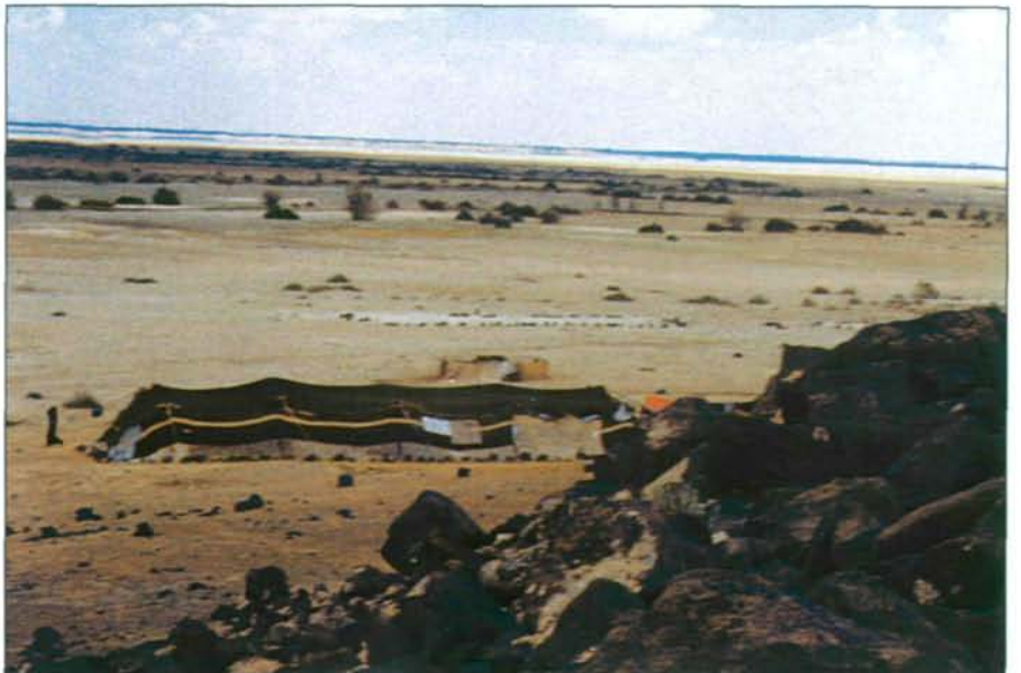
Abb. 4: Die tertiären Basaltdecken des Jebel Druz reichen unmittelbar an die weite, im Frühjahr wasserbedeckte Depression der Oase von Azraq heran.

Nach Süden zu verläuft der wüstenhafte Charakter zwar weniger schroff, bleibt aber – bedingt durch die Niederschlagsarmut unter 100 mm – ein Charakteristikum der monoton flachen Tallandschaft. Sedimente der Kreide und des Jungtertiärs, sowie junge Basaltermgüsse prägen das eintönige Landschaftsbild. Das ist die – außer im Bereich der Phosphat abbauenden Betriebe – am we-