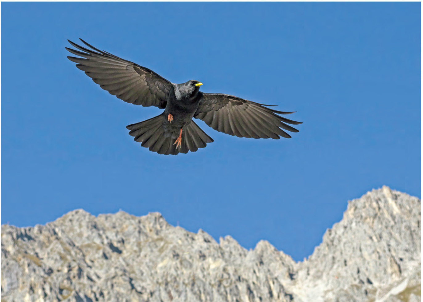
Abb. 2: Alpendohle, als Brutvogel in Höhlungen von Felswänden ist sie perfekt ans Leben im Hochgebirge angepasst; Hafelekar/T (15.10.2017,).