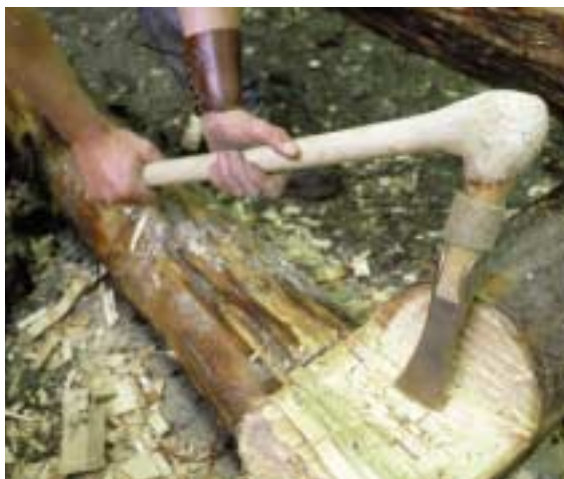
Holzbearbeitung mit rekonstruiertem Lappenbeil

Nach der jüngsten Theorie werden die Blockwandbauten als Surbecken gedeutet, die zum Einsalzen großer Fleischmengen verwendet wurden. Die eingetieften Blockwandbassins (aus dem 12. Jahrhundert vor Christus) und die Schweineknochen hängen vermutlich mit einer frühen fleischverarbeitenden „Industrie“ im Salzbetal zusammen. Es scheint, daß man früher das Fleisch zum Salz brachte und nicht – wie in all den Jahrhunderten danach – umgekehrt.