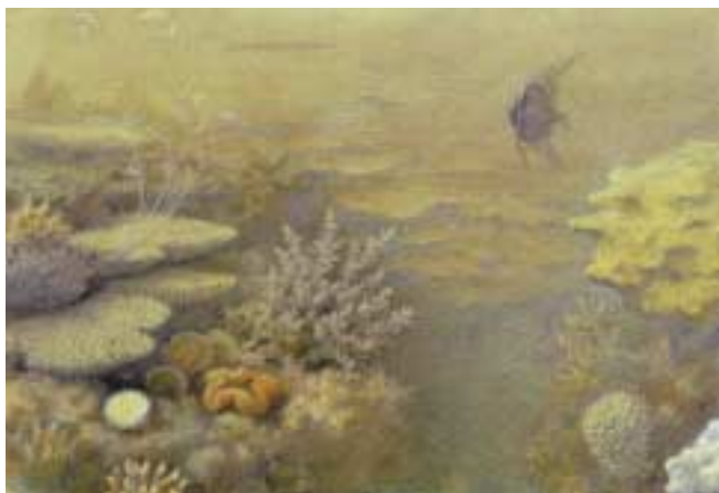
„Korallenbank von Tor nächst der Hafeneinfahrt“, E. v. Ransonnnet

Im Jänner 1862 brach er zu einer Reise in den Orient auf. Im März besuchte er Tor, eine kleine Hafenstadt am Golf von Suez, auf der Halbinsel Sinai. Seinem großen Wissens- und Tatendrang folgend, wollte er die Fauna des Roten Meeres vor Ort kennenlernen. In seinem Reisebericht, den er im darauffolgenden Jahr in Wien veröffentlichte, brachte er dem Leser die Schönheit der Welt unter Wasser in lebhaften und anschaulichen Schilderungen nahe.