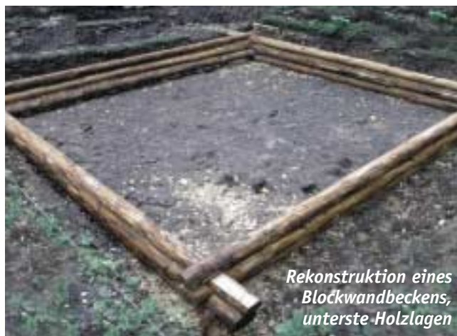
Rekonstruktion eines Blockwandbeckens, unterste Holzlagen