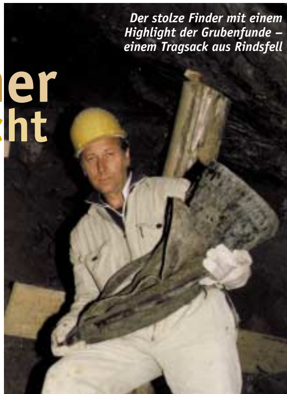
Der stolze Finder mit einem Highlight der Grubenfunde – einem Tragsack aus Rindsfell

Schon bald war klar, daß die Schwierigkeiten und Kosten bergmännischer archäologischer Forschungsarbeit nur den Weg der kleinen Schritte erlaubten. Diese führten nicht immer zielstrebig in die gleiche Richtung, sondern mancher Wechselschritt ergab sich. So bin ich im Laufe der Jahre „nebenbei“ zu einem ganz passablen Tänzer geworden. Näher auf alle Unternehmungen einzugehen, würde den Rahmen dieses Beitrages sprengen, doch sollen einige kurz angesprochen werden: 100 m Grabungstollen im Kilbwerk, der Fundstelle des legen-