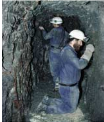
Archäologische „Feinarbeit“ in einem prä- historischen Stollen

Für die Grabungen der letzten Jahre im Salzbergwerk Hallstatt wurden mit Bedacht Stellen ausgewählt, an denen prähistorische Baue mit eingeschwemmten Lockermassen ausgefüllt sind. Dadurch besteht die Möglichkeit, durch Entfernen des eingeschwemmten Materials urzeitliche Hohlräume zurückzugewinnen - ein Unterfangen, das bisher an den riesigen Dimensionen scheiterte. Dies bleibt eine reizvolle und vielversprechende Aufgabe für zukünftige Generationen von Archäologen.