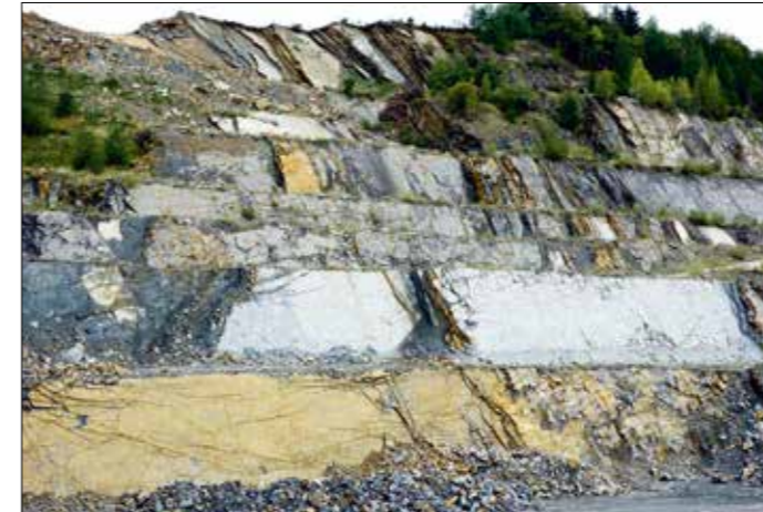
Flyschsteinbruch in Pinsdorf

Bei einer Exkursion im Sommer 2018 in die Flyschzone Oberösterreichs wurde eine einzigartige fossile Spur entdeckt. Nach der aufwendigen Bergung kam der spannende Fund in die Geologisch-Paläontologische Abteilung des NHM Wien.