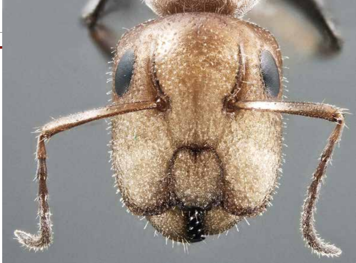
Porträt einer Holzameise aus Borneo, Schichtbildfotografie