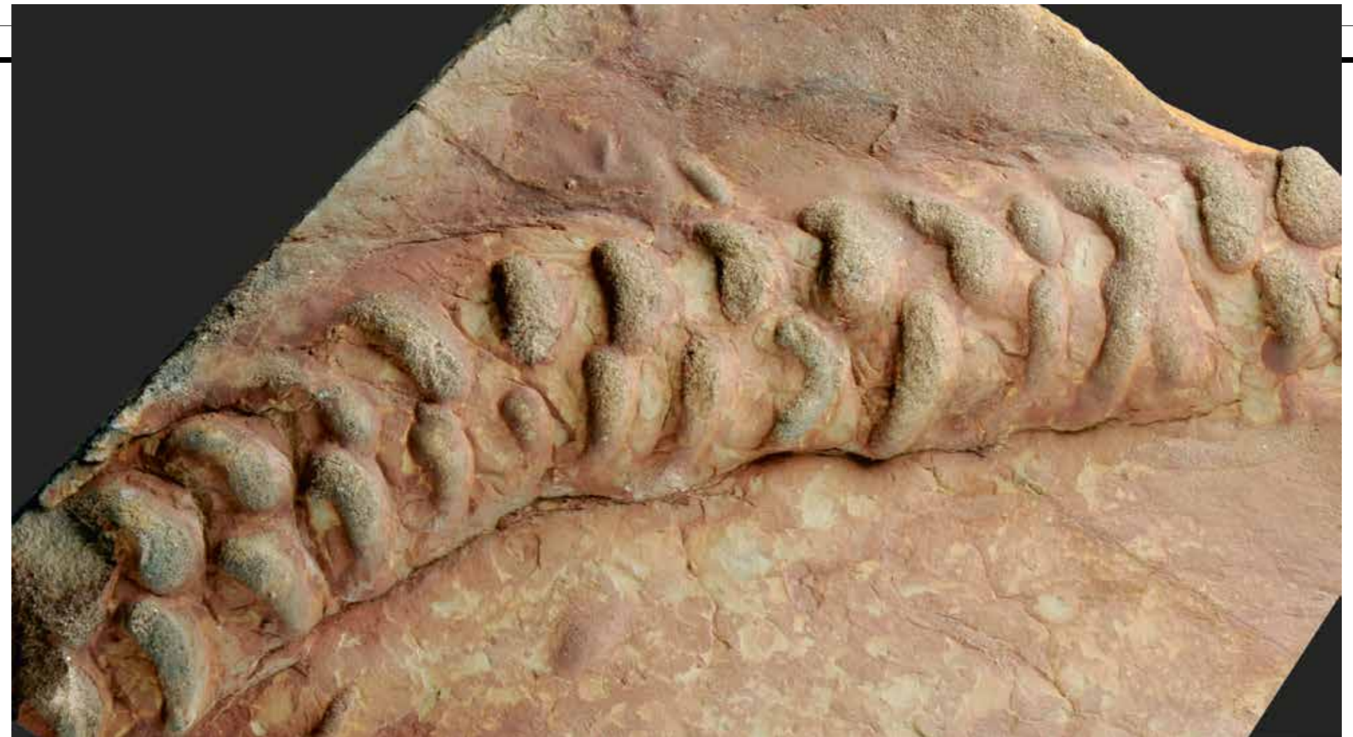
Das Spurenfossil Pinsdorfichnus abeli (Länge: 40 Zentimeter)