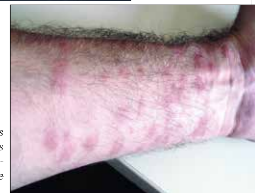
Die Larven des Entensaugwurms können stark juckende Ausschläge hervorrufen.

vorkommen. Für Fischer kann dies eine lästige Berufskrankheit darstellen, für Badende eine Minderung der Badefreuden – und für Betreiber von Badegewässern kann der Ausbruch zur Sperre des Gewässers und zu empfindlichen Einkommenseinbußen führen. Im Rahmen von ABOL soll am NHM, in Zusammenarbeit mit der Oberösterreichischen Gewässergüteaufsicht, ein Nachweissystem entwickelt werden, bei dem Wasserproben auf das Vorhandensein von Erregern und Überträgerschnecken überprüft werden.