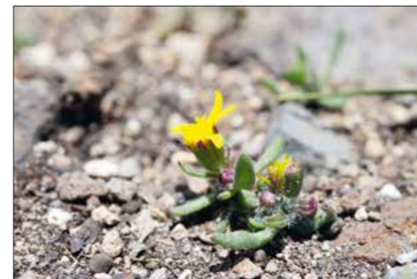
Senecio iranicus , ein Greiskraut vom Damavand