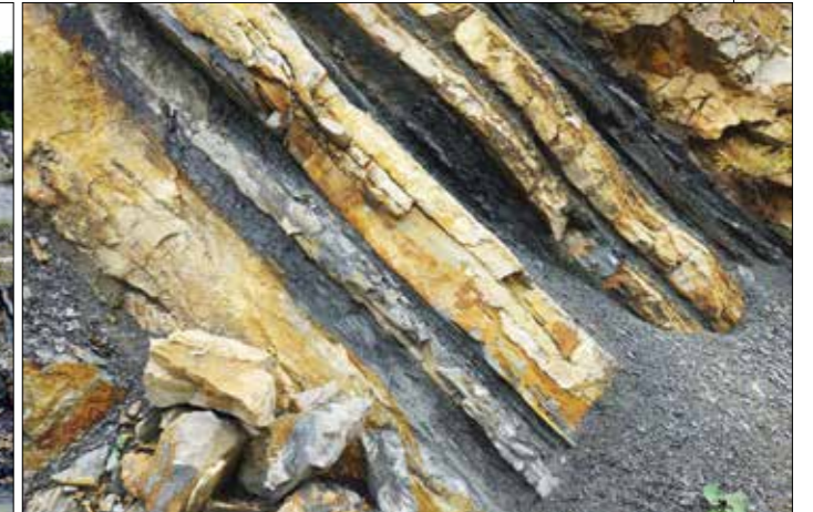
Flyschgesteine aus der späteren Kreidezeit