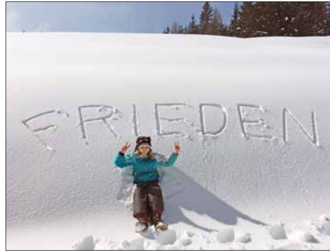
Katrin Hinteregger: Neuschnee

Erforderlich ist eine Anmeldung unter www.nhm-wien.ac.at/fuehrungen/anmeldung oder +43 1 521 77 335.