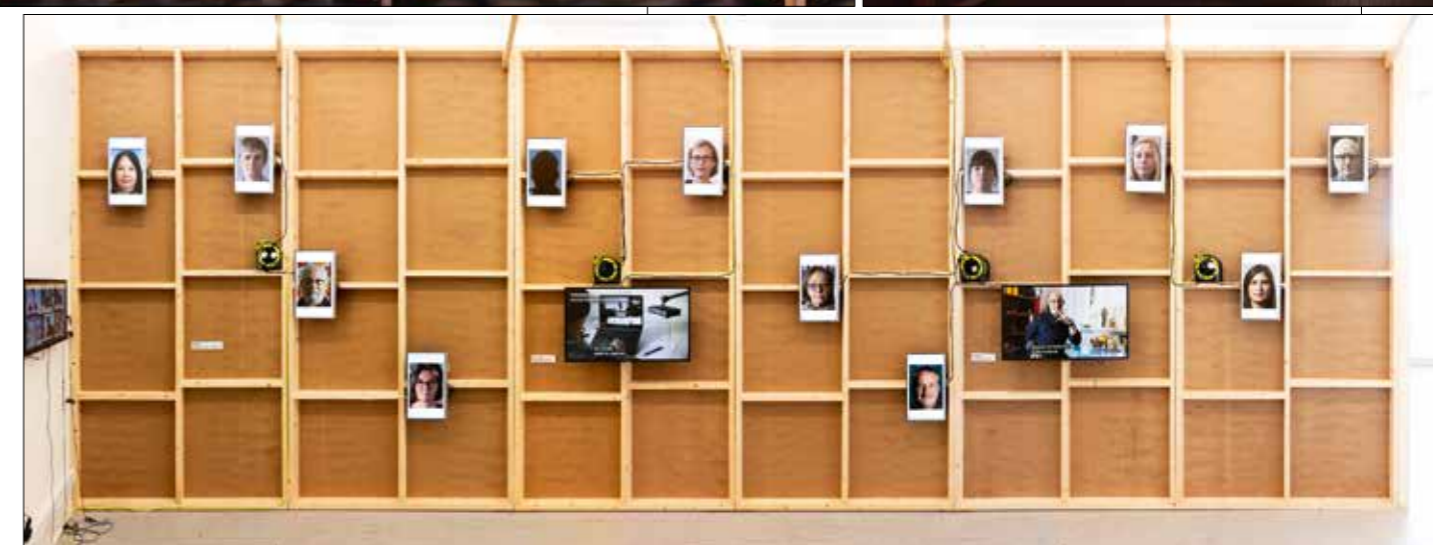
Video Installation, „Dead Images“-Ausstellung im Edinburgh College of Art, 2018