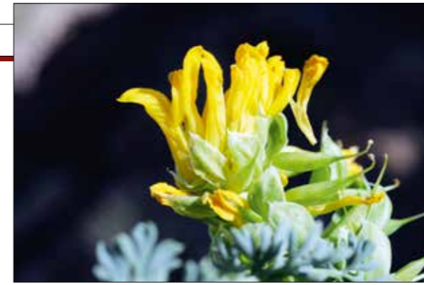
Corydalis rupestris , beschrieben auf Basis einer Aufsammlung von Kotschy