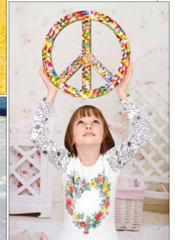
Nikolay Dimitrov: The peace on earth is in the hands of children

Im 20. Jahrhundert entstanden globale Mechanismen und Einrichtungen zur Friedenssicherung. Die Europäische Union trägt zum Frieden in Europa bei – einem Kontinent, in dem jahrhundertlang Kriege geführt wurden. Wie kann man den Frieden beschreiben? Wie könnte eine Gesellschaft des Friedens aussehen? Nach dem Besuch der Ausstellung wird gemeinsam ein Bild dieser Gesellschaft entworfen und niedergeschrieben. In einem Buch werden alle Utopien gesammelt und am Ende der Ausstellung dem Bundespräsidenten übergeben.