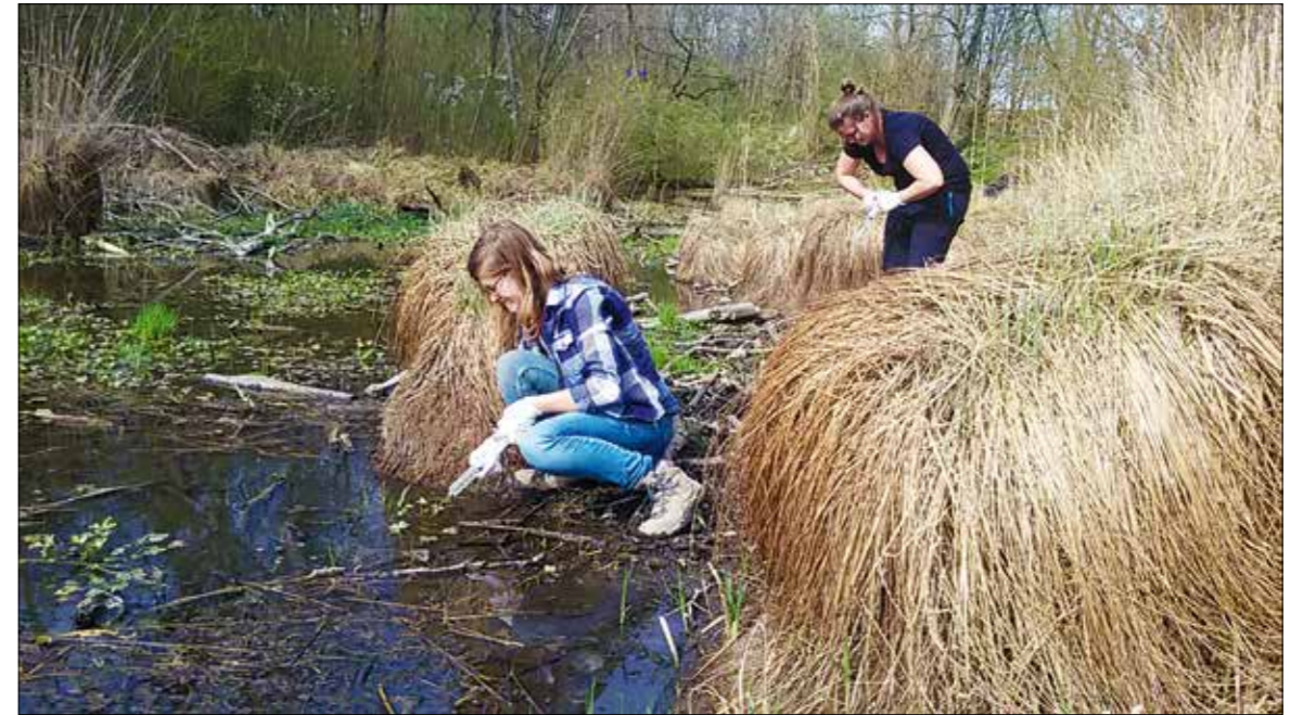
Entnahme von Wasserproben für die Analyse von Umwelt-DNA

VON HELMUT SATTMANN, ELISABETH HARING UND NIKOLA SZUCSICH