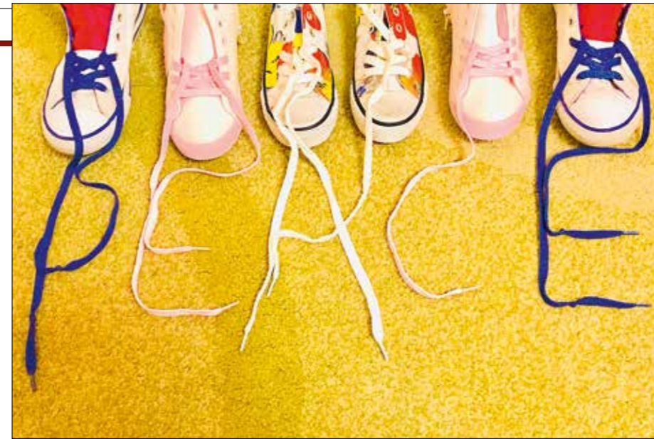
Lachezara Tomova: The colorful shoes of peace

Der Krieg hat sich auch in der Gegenwart wieder als alltägliches globales Phänomen etabliert und wird oft unreflektiert als probates Mittel zur Erhaltung des Friedens betrachtet. Im Workshop wird das Leben von Bertha von Suttner behandelt, es werden zentrale Textstellen aus ihrem berühmten Roman „Die Waffen nieder“ gelesen und diskutiert. Daraufhin können die Besucherinnen in der Ausstellung, direkt mit den Auswirkungen historischer Kriegsgeschehnisse konfrontiert, eigene Texte schreiben, die später besprochen werden.