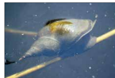
Die Spitzhornschnecke ist eine von mehreren Wasserschneckenarten, die als Zwischenwirte für den Entensaugwurm dienen.

Tropische Gewässer bergen zahlreiche Gesundheitsgefahren. Eine dieser im Wasser übertragenen Krankheiten ist die Bilharziose, ein Wurminfekt des Menschen, der zu ernstesten Erkrankungen der inneren Organe führt. In Mitteleuropa gibt es harmlosere Arten, die eigentlich Vögel parasitieren, aber beim Menschen unangenehme Hautausschläge hervorrufen. Der Befall des Menschen ist mit starkem Juckreiz – der sogenannten „Bade-Dermatitis“ – und mitunter mit Sekundärinfektionen verbunden. Die infektiösen Larven werden von Schnecken ausgeschieden und bohren sich in die Haut des (vermeintlichen) Endwirts. Die Bade-Dermatitis tritt daher oft nach dem Baden in Naturgewässern auf, in denen sowohl Überträgerschnecken als auch die eigentlichen Zielscheiben der Parasiten, die Wasservögel,