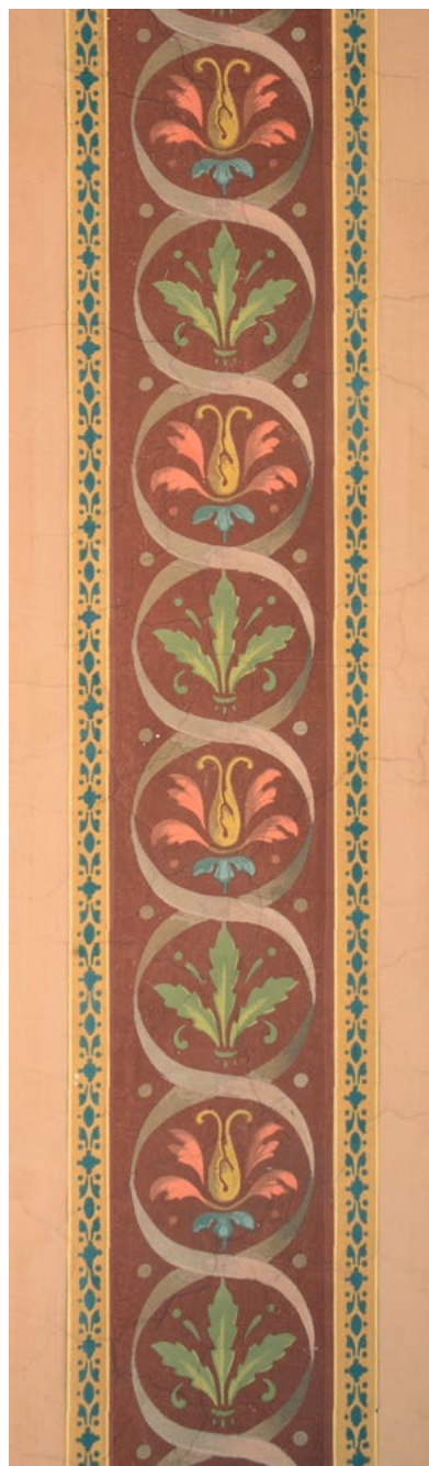
Detail der floralen Zierleisten an der Decke des Knabenzimmers

und Sammlungskästen mit den Initialen von Kaiser Franz Josef vervollständigen das Interieur.