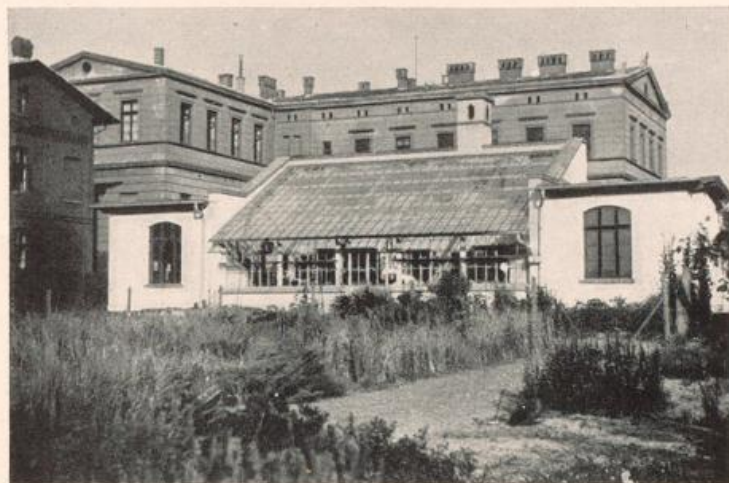
Das von NOLL am Botanischen Institut der Landwirtschaftlichen Akademie zu Bonn erbaute Versuchshaus. (Im Hintergrunde das alte Naturwissenschaftliche Lehrgebäude, das u. a. das Botanische Institut enthielt.)