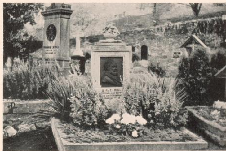
NOLLs Grab auf dem Friedhof zu St. Goar.