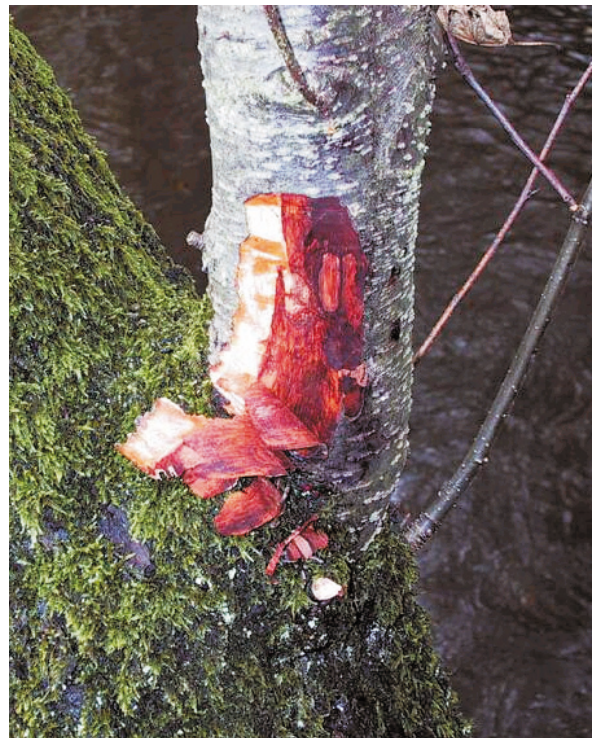
Abb. 5: Kambiumnekrosen als scharf abgrenzte rot-braune Bereiche unter der schwarz-braun-gefleckten Rinde (Köllerbach, September 2001)