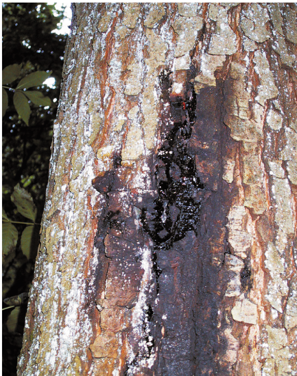
Abb. 4: Aufgerissene Rinde mit Schleimfluss („Wundgummi“) an einer Schwarzerle (Netzbach, August 2001)