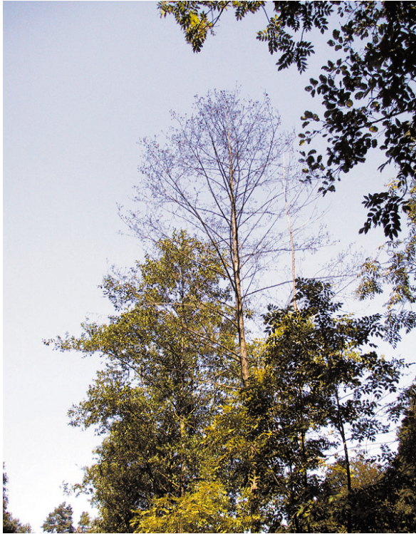
Abb. 2: Kronenauflichtung an einer Schwarzerle (Köllerbach, August 2001) sind die ersten Anzeichen einer Erkrankung