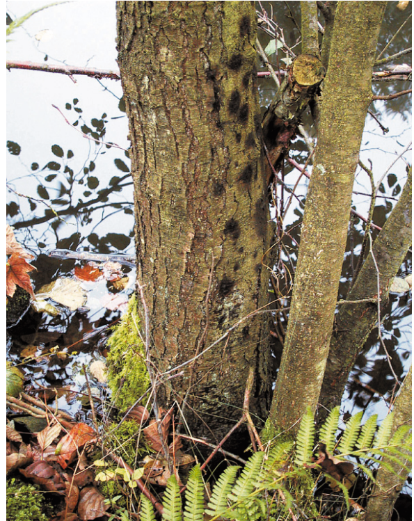
Abb. 3: Schwarz-braune, nässende Bereiche („Teerflecken“) am Stammgrund einer Schwarzerle (Niederwürzbacher Weiher, Okt. 2001) deuten auf eine Infektion mit Erlen- Phytophthora hin.