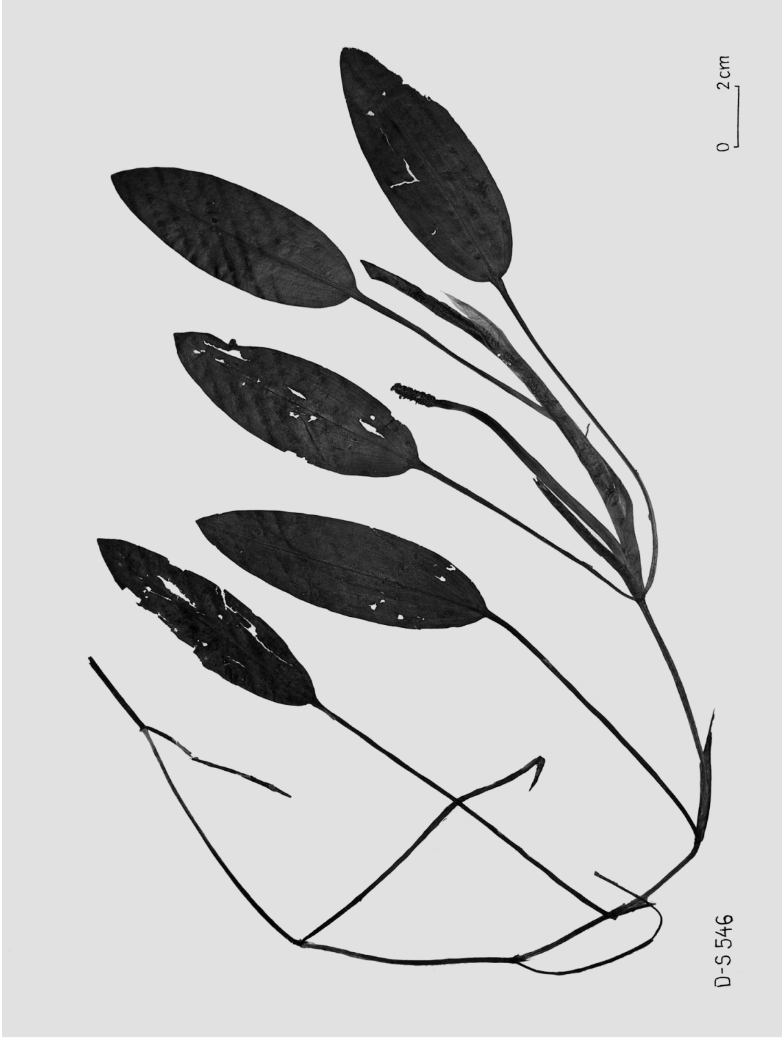
Abb. 2: Blühendes Sprossende von Potamogeton xschreberi mit dickem Ährenstiel und Schwimmblättern in der Blies (Reinheim/Saarland, 11.8.1996)