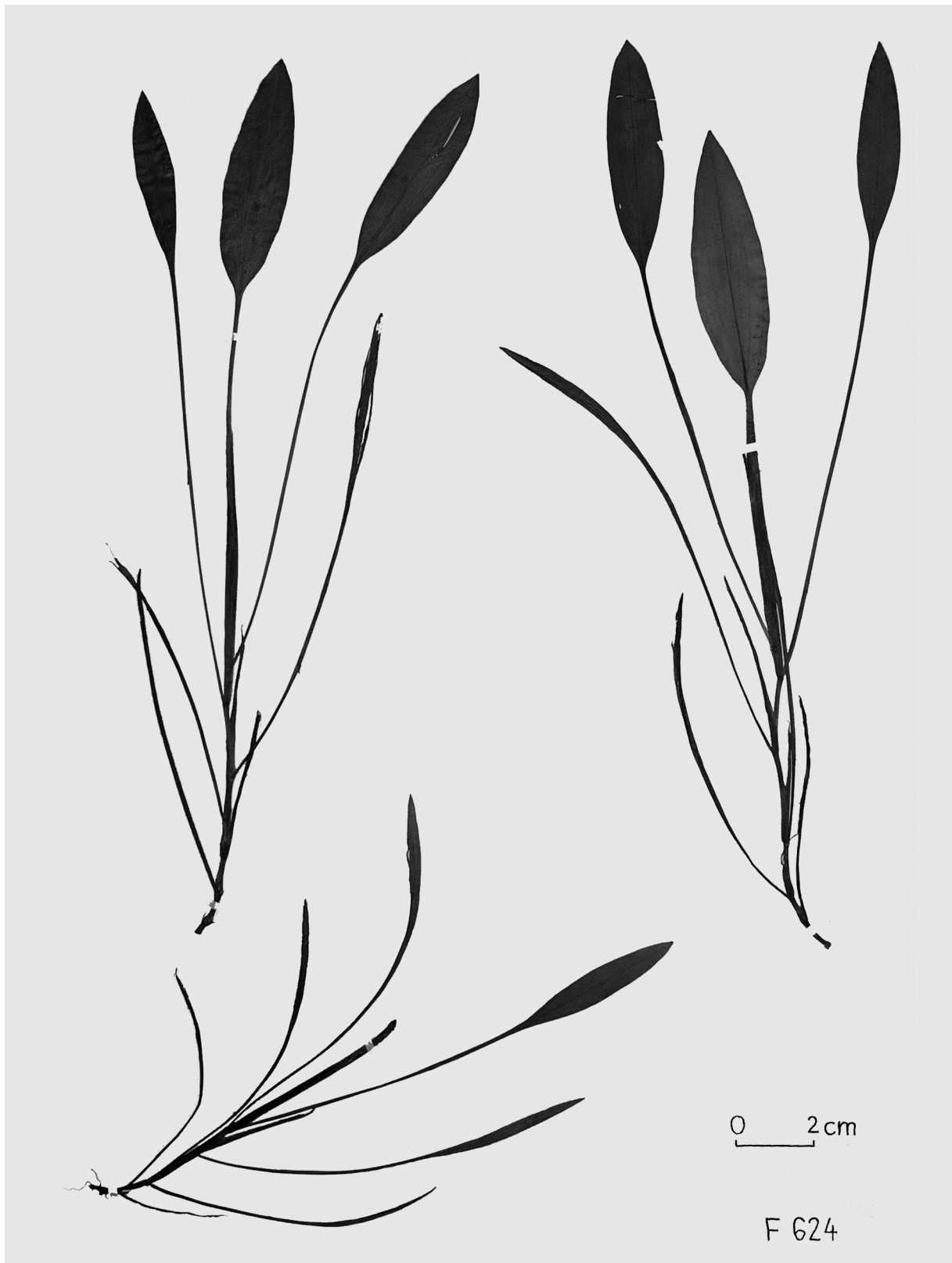
Abb. 3: Tauch- und Übergangsblätter von Potamogeton xschreberi in der Blies (Bliesbruck/Moselle, 25.7.1999)