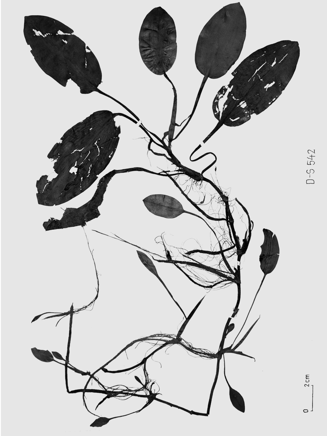
Abb. 4: Abgerissener Schwimmblattspross von Potamogeton xschreberi in der Saar mit neu austreibenden Wurzeln und jungen Blättern (Hanweiler/Saarland, 23.8.2003)