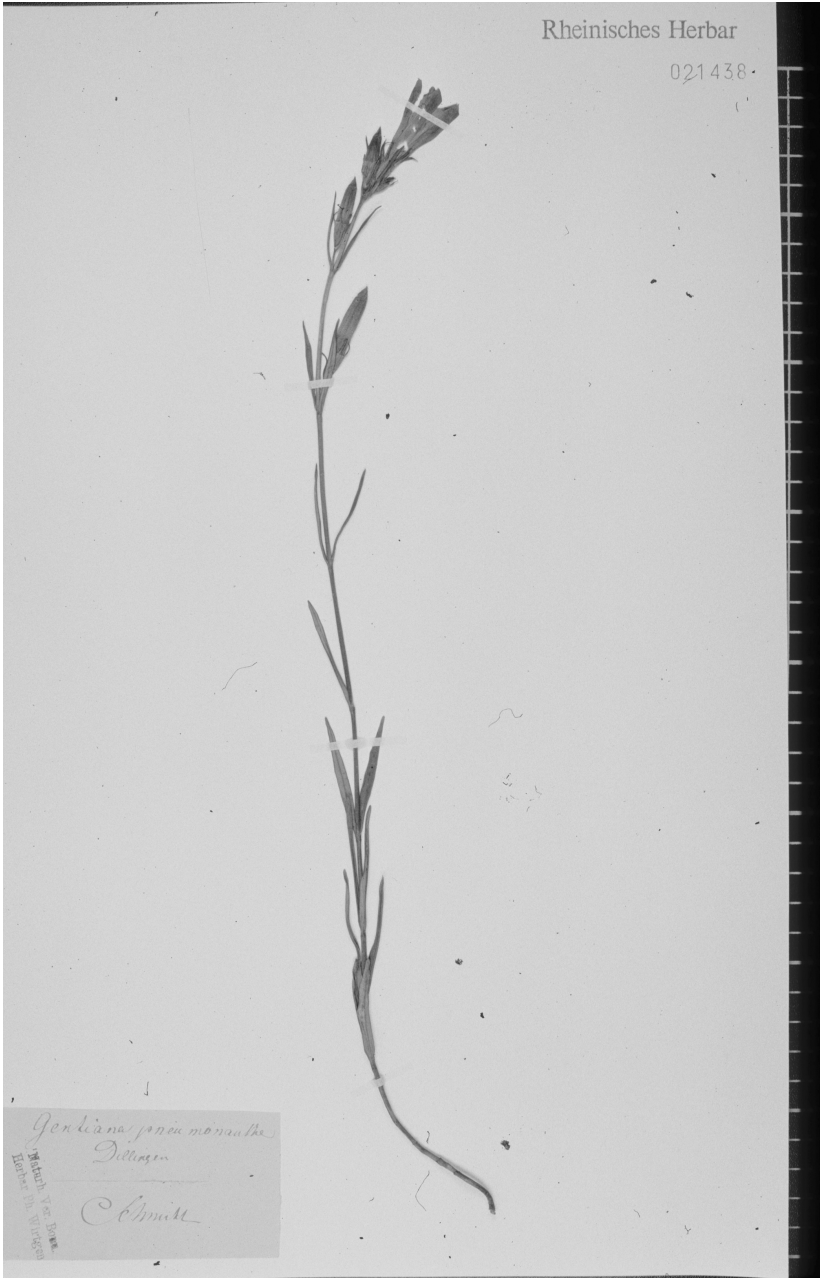
Abb. 4: Herbarbeleg von Gentiana pneumonanthe , gesammelt v. Ph. Schmitt, Rheinisches Herbar (NHV) Bonn. Die Art kommt heute im Raum Dillingen nicht mehr vor.