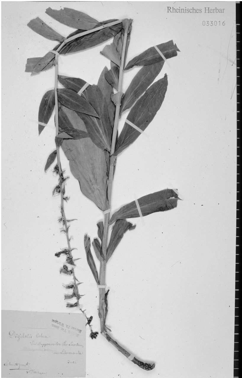
Abb. 5: Herbarbeleg von Digitalis lutea , gesammelt v. Ph. Schmitt, Rheinisches Herbar (NHV) Bonn. Die Art kommt heute im Raum Dillingen nicht mehr vor.