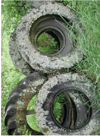
Abb. 3: Ausschnitt aus der Reihe außergewöhnlich stark von Flechten bewachsenen Traktorreifen. Sie bilden die Grenze des Naturschutzgebietes im Südwesten des Nackberges oberhalb des Hofgutes