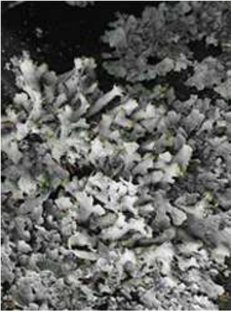
Abb. 2: Habitus von Parmelia submontana mit langgestreckten eingerollten Thallusloben, eingefasst von Parmelia sulcata mit flachen, geringfügig dunkleren Thallusloben auf einem alten Traktorreifen