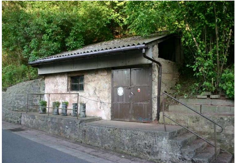
Abb. 2: Felsenkeller Eingang