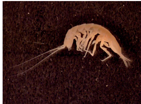
Abb. 3: Proasellus cavaticus in unterschiedlicher Vergrößerung