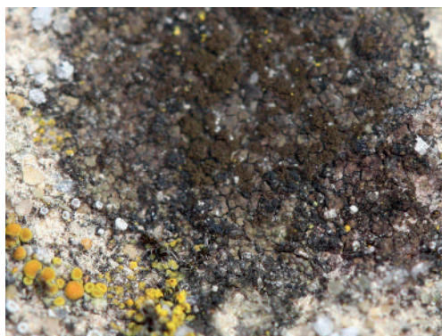
Abb. 9: Verrucaria tectorum wächst hier auf altem Mörtel