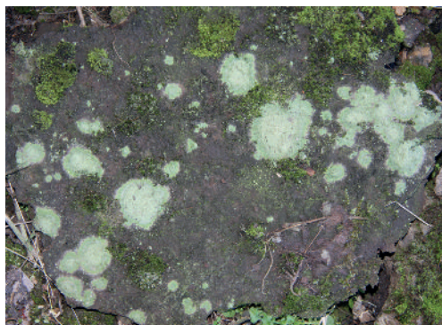
Abb. 5: Baeomyces rufus mit Moosen auf einer Eisenplatte nahe den Hochöfen