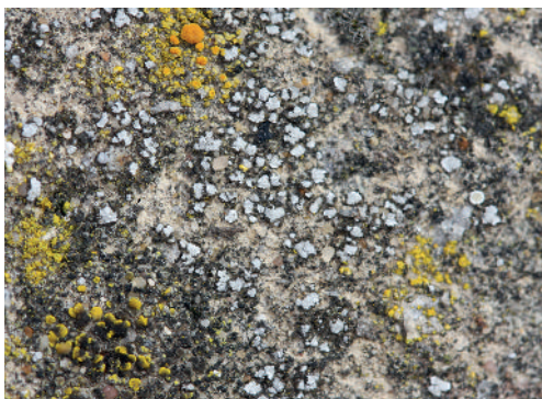
Abb. 4: Acarospora moenium wurde an einem Betonpfeiler und an einem Eisenrohr beobachtet