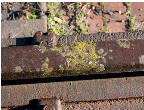
Abb. 8: Candelariella vitellina auf einer Schiene vor der ehemaligen Kokerei