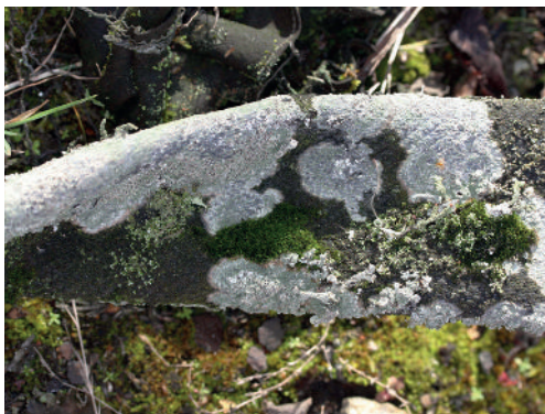
Abb. 6: Diploschistes muscorum auf Asbest-Gummi-Schlauch