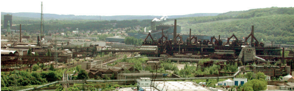
Abb. 1: Blick auf das Gelände der Völklinger Hütte mit der ehemaligen Kokerei und den Hochöfen rechts im Bild.

Die Bedeutung alter Kupferschiefer-Halden hat HUNECK (2006) eindrucksvoll beschrieben. Berichte über Erst- und Wiederbesiedlung von Industrieanlagen durch Flechten sind noch spärlich (FEIGE & KRICKE 2001, 2002, JOHN 2006b). Es häufen sich jedoch in letzter Zeit die Hinweise auf die Besiedlung künstlicher anthropogener Substrate durch Flechten, wie Plastik STOLLEY 2000), Gummi (JOHN 2006c) und vor allem Eisengegenstände (JOHN 1979, 2010).