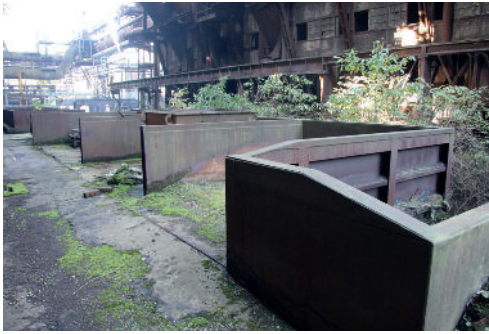
Abb. 2: Typischer Lebensraum der Veizdaea - auf Eisen am Arten. Standort wie in Abb 2.