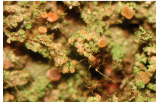
Abb. 3: Veizdaea leprosa