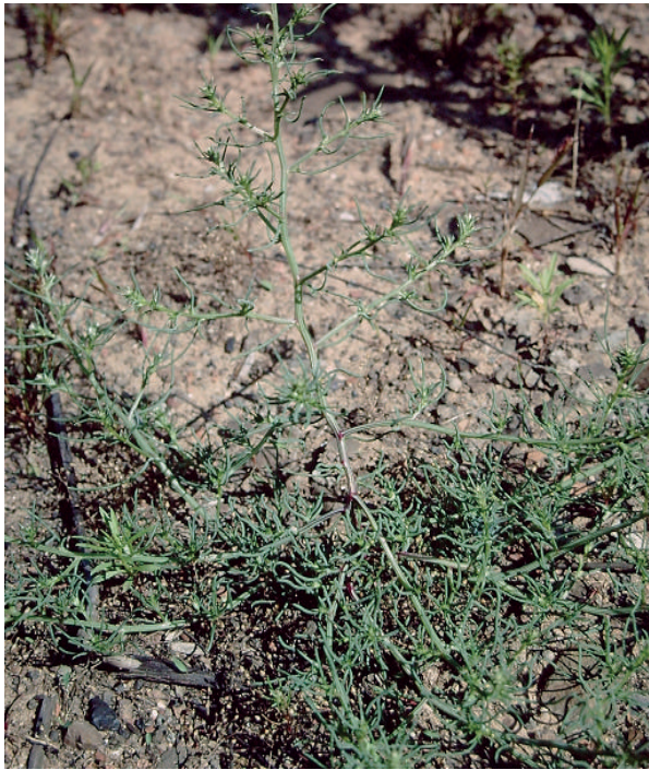
Abb. 2: Einzelpflanze vom Bocks-Salzkrout ( Salsola tragus L. subsp. tragus ) am Bahnhof Scheidt im September 1990.