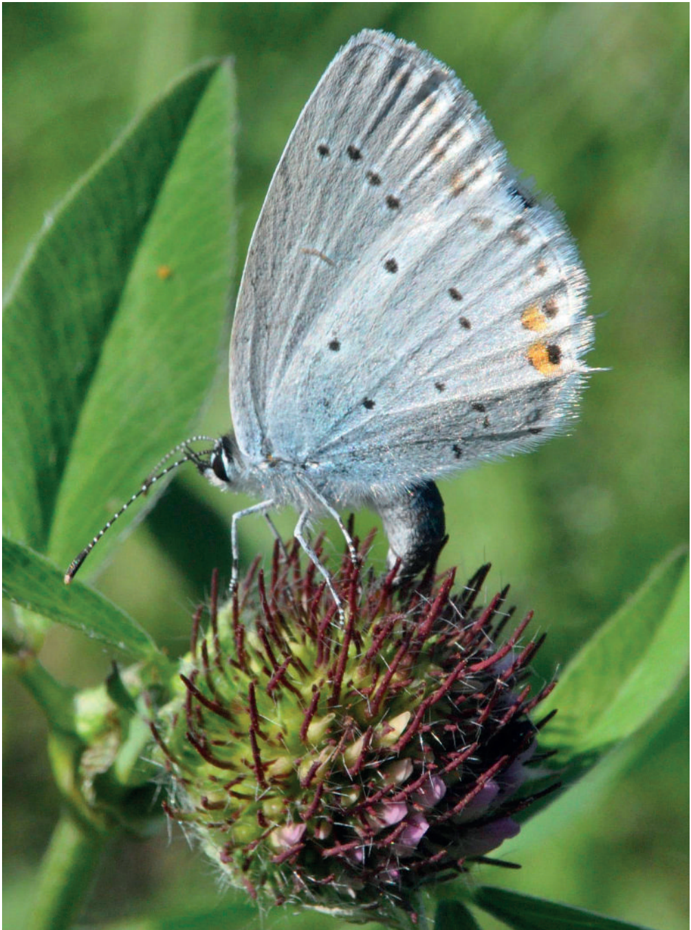
Abb. 1: Ein Weibchen des Kurzschwänzigen Bläulings ( Cupido argiades) bei der charakteristischen Eiablage in ein noch nicht aufgeblühtes Blütenköpfchen des Rotklee ( Trifolium pratense ;).