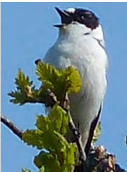
Abb. 6: Singender Halsbandschnäpper am 10.05.2013 im Merzenwald/Frankreich zwischen Obergailbach u. Medelsheim.