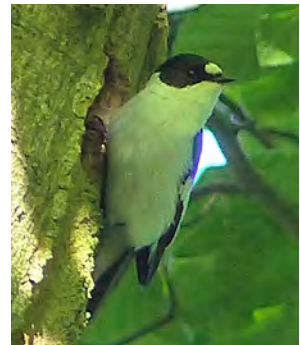
Abb. 7 – 9: Halsbandschnäpper-Männchen am 6.5. und 2 Fotos vom 28.5.2013 im Naturschutzgebiet Hoxfels bei Schmelz.