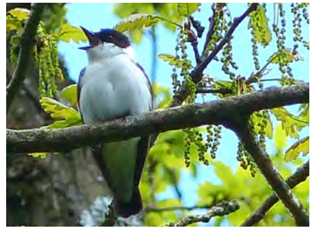
Abb. 4 – 5: Halsbandschnäpper-Weibchen am 8. und 12.6.2013 an Bruthöhle 5 (1/2013). Brücker Berg