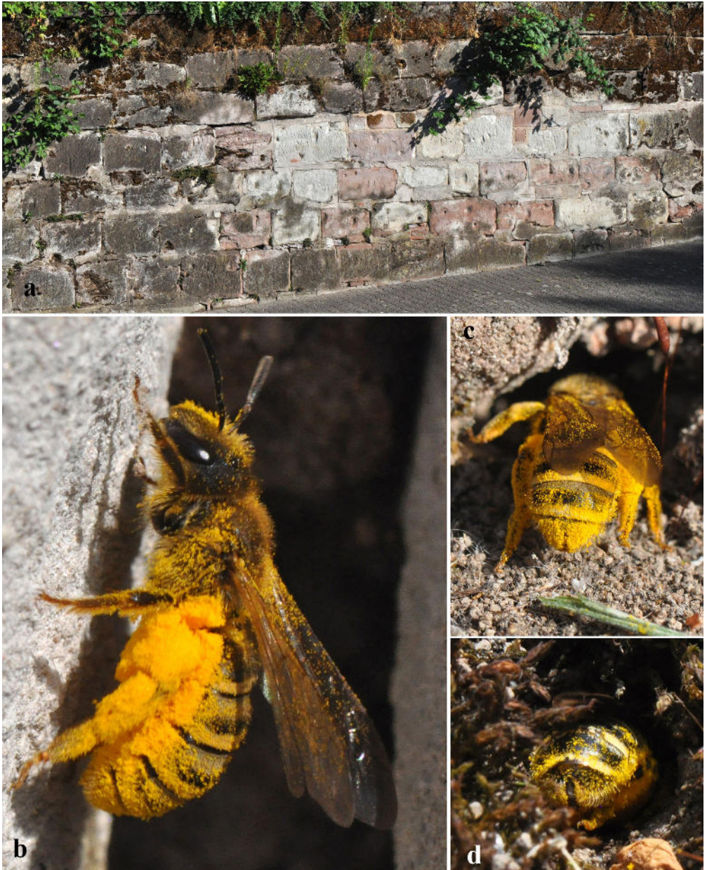
Abb. 1: Nistplätze der Gelbbindigen Furchenbiene ( Halictus scabiosae ) in der Mauer des Hornwerks am Saarlarm. a In diesem Abschnitt der Mauer konnten rund 50 Nesteingänge gezählt werden. b-d Pollenbeladene Weibchen bei der Rückkehr in die Nester (27.6.-4.7.2015).