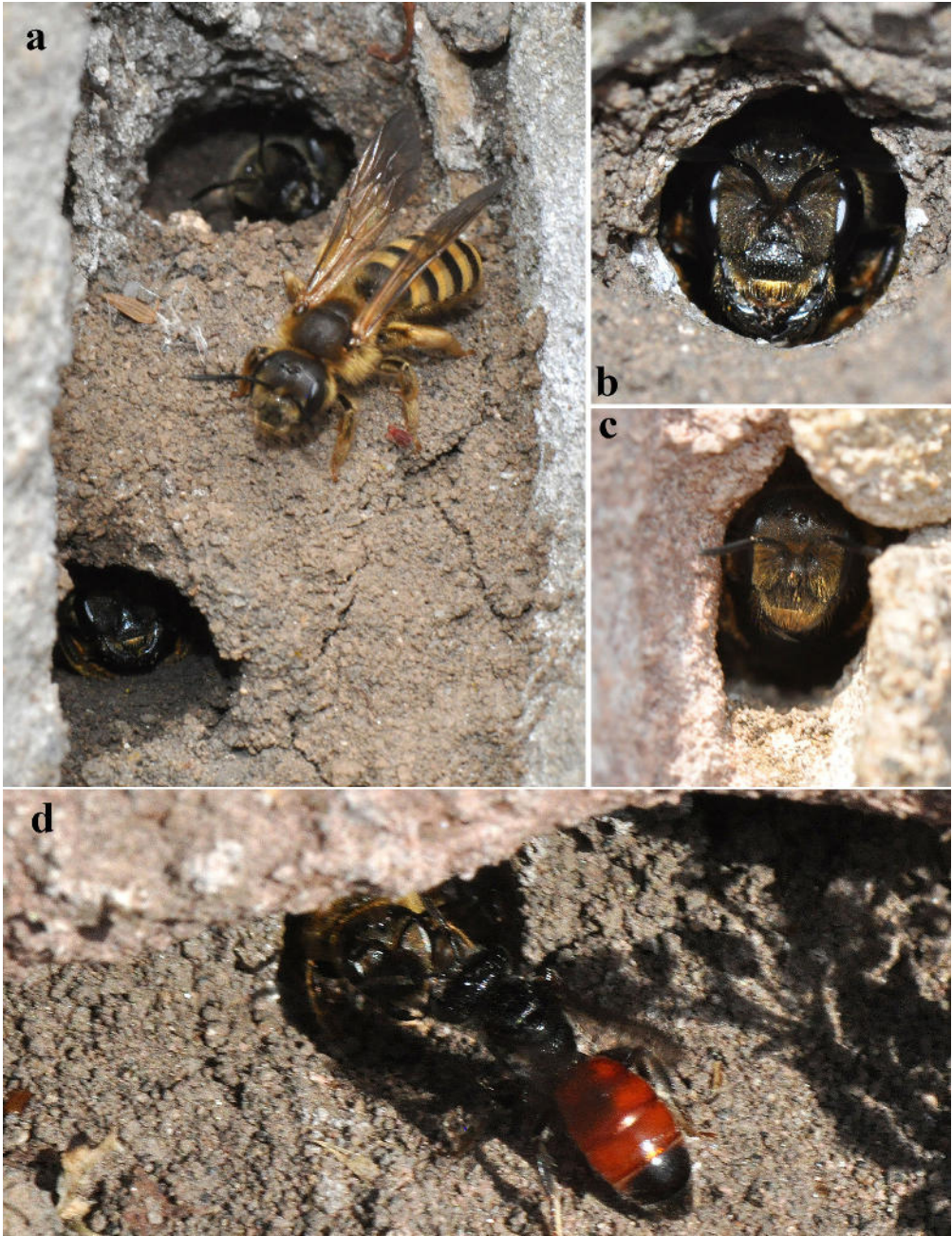
Abb. 2: Nesteingänge mit Wächterinnen von Halictus scabiosae . a Neben dem abflugbereiten Weibchen sind 2 Nesteingänge mit Wächterinnen in der sandigen Füllung einer senkrechten Mauerfuge erkennbar (27.6.). b, c Porträts von Wächterinnen (27.6./31.7.). d Eine Wächterin verwehrt einer Blutbiene Sphecodes cf. gibbus den Zugang zum Nest (4.7.).