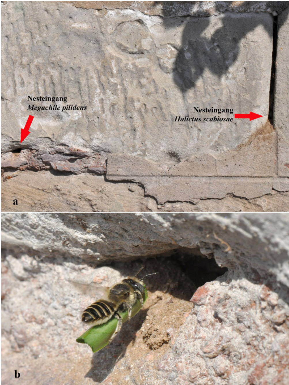
Abb. 6: a Benachbarte Nesteingänge von Megachile pilidens und Halictus scabiosae . b Weibchen von M. pilidens mit Blattstück im Anflug ans Nest.