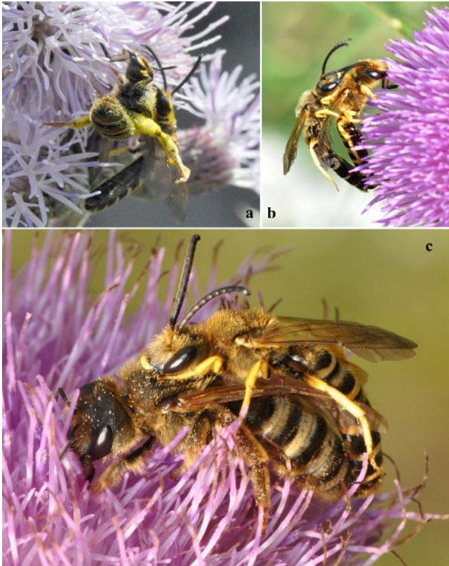
Abb. 4: Kratzdistel-Blüten als Rendezvous-Plätze (5.7.). a Weibchen wehrt Männchen ab (auf Cirsium arvense ). b Ein Männchen hat irrtümlich ein anderes Männchen ergriffen. c Erfolgreiche Paarung auf C. vulgare .