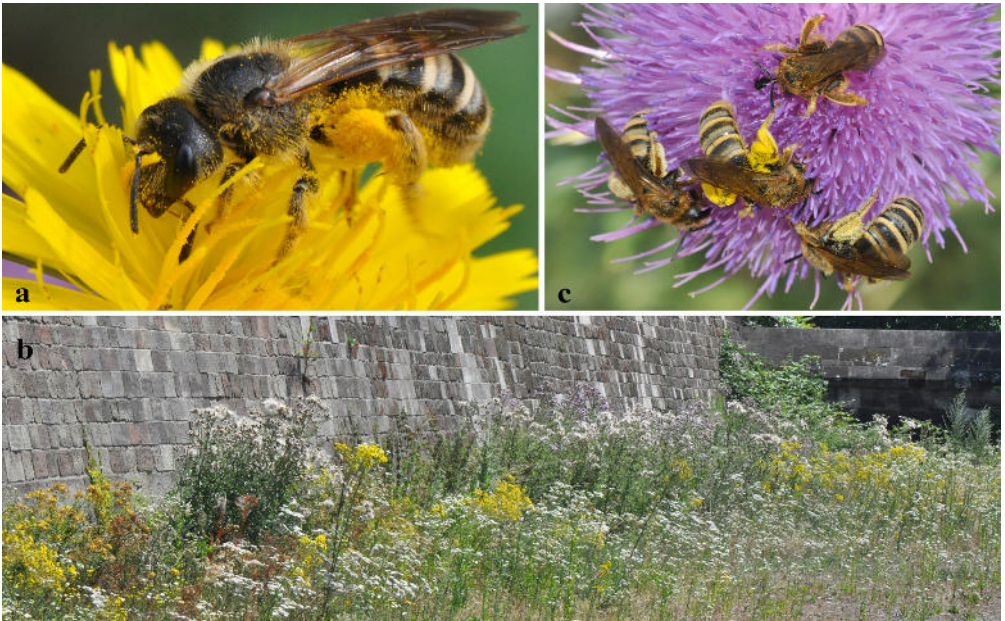
Abb. 3: a Weibchen von Halictus scabiosae sammelt Pollen und Nektar auf einem Ferkelkraut-Blütenköpfchen ( Hypochaeris radicata , 27.6.). b Ruderalvegetation im Wallgraben (11.7.). c Vier Weibchen auf einem Blütenköpfchen der Gewöhnlichen Kratzdistel ( Cirsium vulgare , 5.7.).

Halictus scabiosae erwies sich während der Sommermonate bis zum Ende der regelmäßigen Kontrollen am 11. August auf den blütenreichen Grün- und Ruderalflächen als bei Weitem häufigste Wildbiene. Eine erneute Begehung am 3. September brachte Ernüchterung: Die gesamte Ruderalvegetation war restlos abgemäht worden. Da auch die kurz gemähten Grünflächen kein Blütenangebot mehr lieferten, waren hier keine weiteren Beobachtungen mehr möglich.