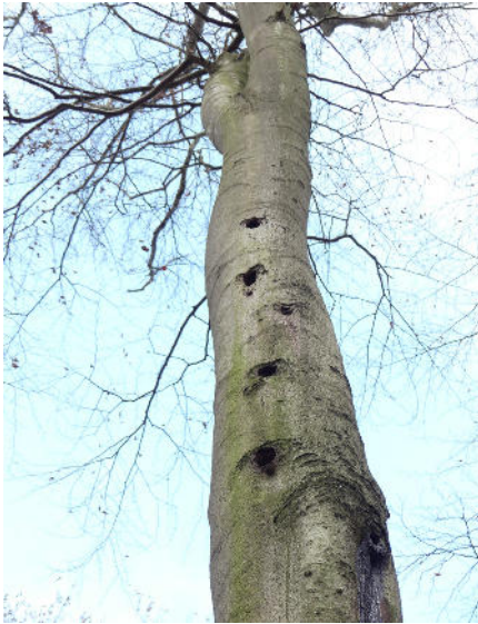
Abb. 4: Schwarzspecht-Höhlen-Buche (sogenannte „Spechtflöte“) in Altholzinsel von Forst-Abt. 199 im Warndt am 10.11.2015.

In Fläche 1 waren leider einige Buchen bei einem Jägerhochstand mit schrägen roten Fällzeichen versehen. In Fläche 2 wurde eine Buche mit großen Insekten-Suchlöchern des Schwarzspechts dokumentiert (Abb. 6). Fläche 3 war durch Schirmschlag aufgelockert, erschien aber als die naturschutzfachlich wertvollste Fläche mit zahlreichen Höhlenbäumen und stehendem Totholz. Am 12.11.15 wurde dort Herbstbalz von 2 Schwarzspechten beobachtet, ein Waldkauz verließ eine hohle Buche durch einen Stammspalt unter 2 Schwarzspecht-Höhleneingängen, außerdem wurden am selben Tag dort Bunt-, Mittel- und Grünspecht nachgewiesen.