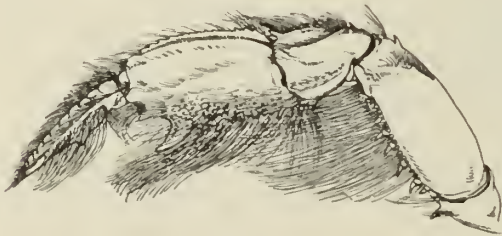
Fig. 7. Gebia major .

Da keiner der bisherigen Untersucher diese Art mit der japanischen Gebia major (DE HAAN) direkt vergleichen konnte, so hole ich dies nach.