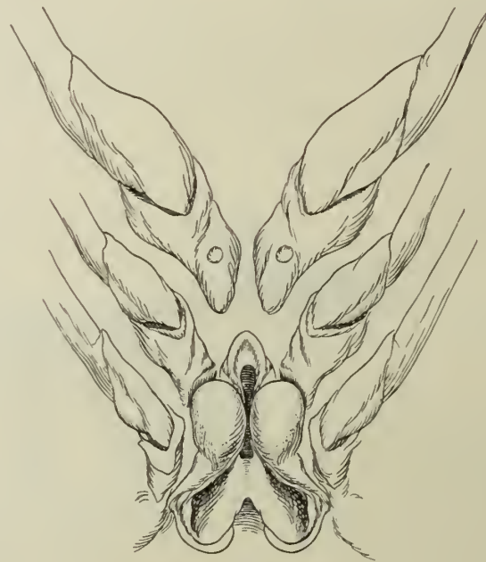
Fig. 6. Thelycum.

Das Telson erreicht etwa \frac{2}{3} der Größe des 6. Segmentes; an einem Ende trägt es einen einzigen Stachel. Die inneren Platten des Schwanzfächers übertreffen das Telson an Länge und werden selbst wieder von den äußeren Platten bedeutend überragt.