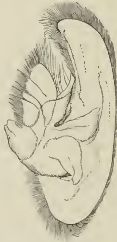
Fig. 3. Zweite Maxille.