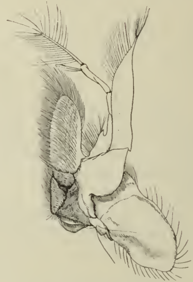
Fig. 4. Erster Maxillarfuß.