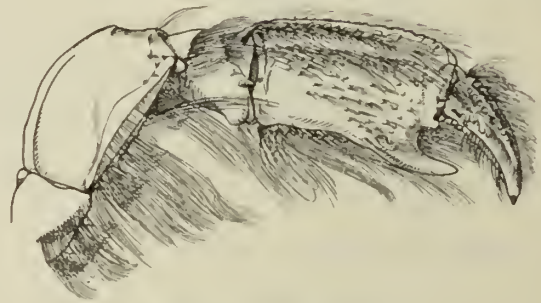
Fig. 8. Upogebia capensis .

Abgesehen von der Größe — die japanischen Exemplare werden, wie schon KRAUSS bemerkte, viel länger — liegt der Unterschied hauptsächlich in der Gestalt der Scherenfüße.