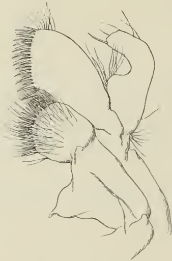
Fig. 2. Erste Maxille.

Die Abdominalsegmente sind oben gerundet, nur das 5. trägt am Ende und das 6. in seiner ganzen Länge einen feinen Kiel.