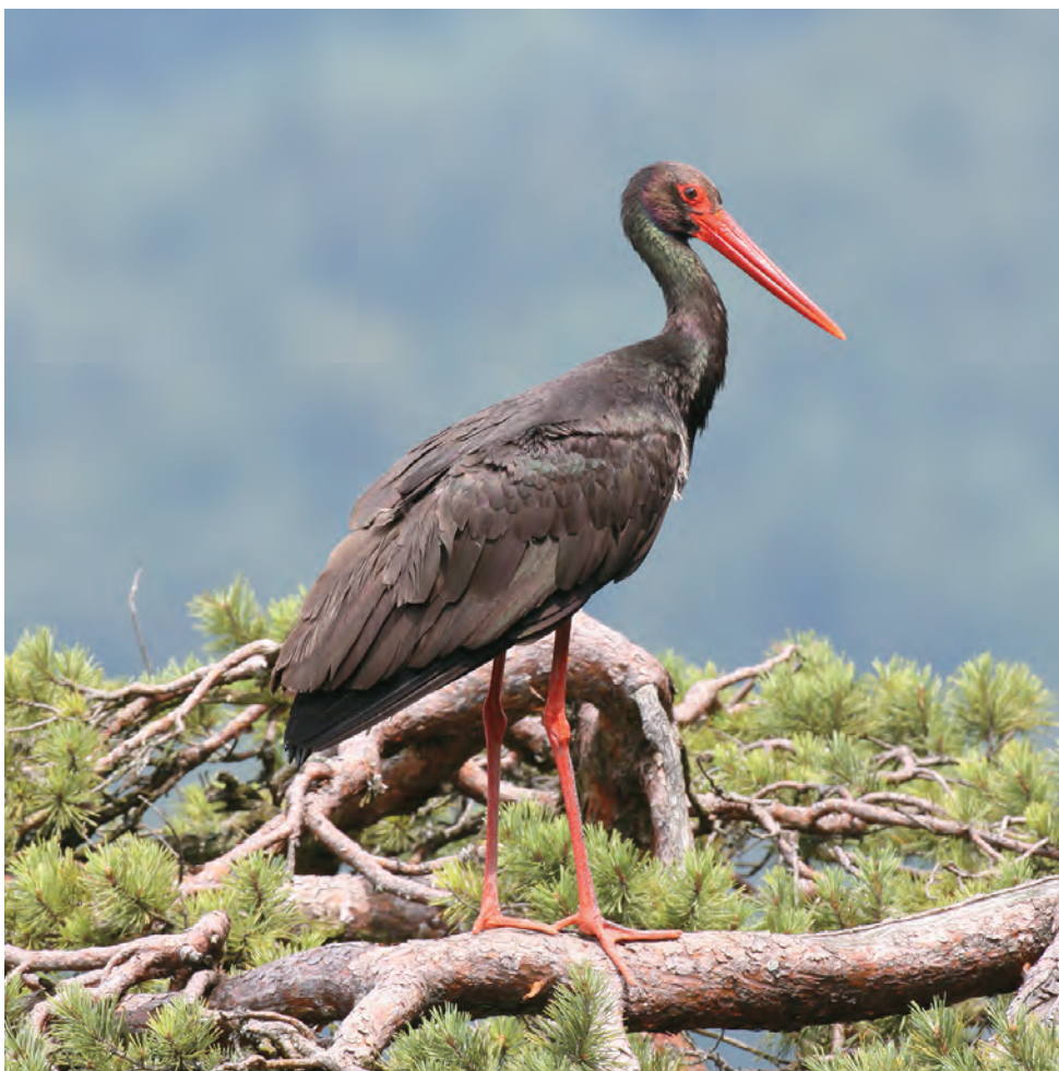
Abb. 3: Im Gegensatz zum Weißstorch ist der Schwarzstorch sehr menschen scheu und braucht große ungestörte Waldgebiete.

Schlögener Schlinge und im Aschachtal sind trotz absoluter Geheimhaltung verlassen und nur mehr selten lässt sich ein kreisender Schwarzstorch beobachten.