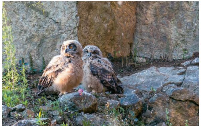
Abb. 2: Junguhus, typischerweise auf einem Felsvorsprung ohne Nestbau.