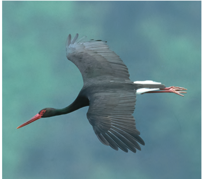
Abb. 4: Beim Schwarzstorch ist im bayerisch-oberösterreichischen Donautal leider ein enormer Rückgang zu verzeichnen.

Seit Jahrzehnten gehört der Schwarzstorch ( Ciconia nigra ) zu den Juwelen der heimischen Vogelwelt. Insbesondere in den unberührten Naturwäldern des Oberen Donautals und seiner Seitentäler fühlt er sich wohl. Im Gegensatz zum Weißstorch meidet er den Menschen und brütet in ausgedehnten störungsfreien Wäldern. Doch seit einigen Jahren bemerken Vogelkundler der Naturschutzgruppe Haibach einen auffälligen Rückgang. Mehrere früher besetzte Horste im Bereich der