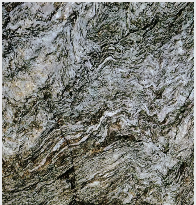
Abb. 12: Phyllit (Zwercheck).