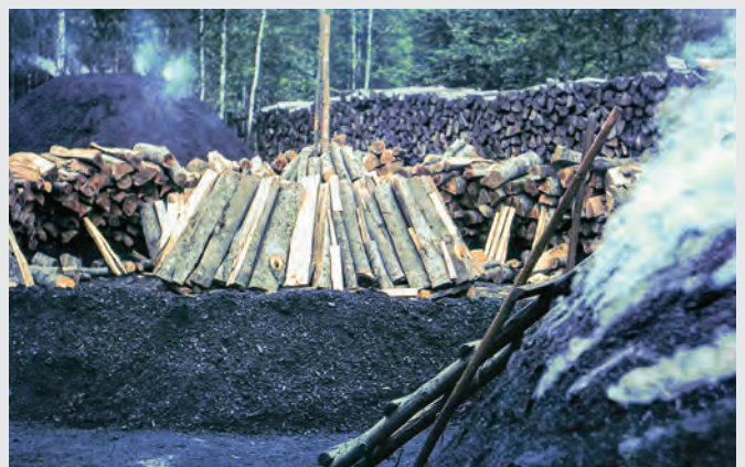
Abb. 20: Köhlerei in Zwieselau.