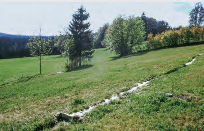
Abb. 17: Wässerwiese in Gschwendet.