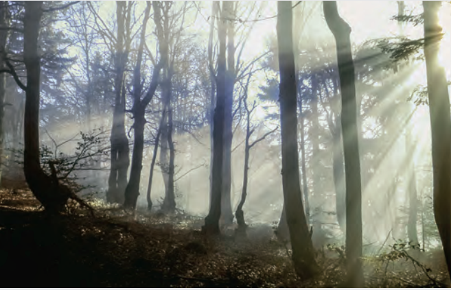
Abb. 13: Stimmung im Bayerischen Wald.