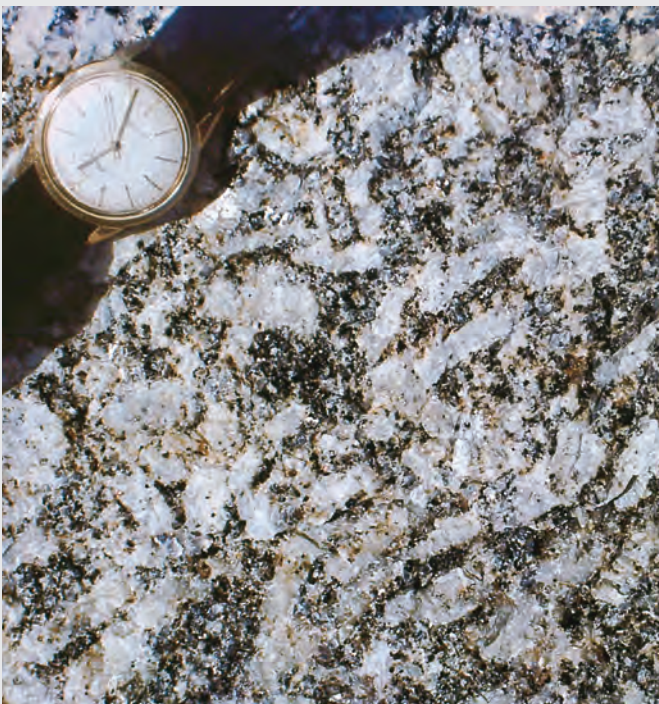
Abb. 11: Grobkörniger Dreisesselgranit.