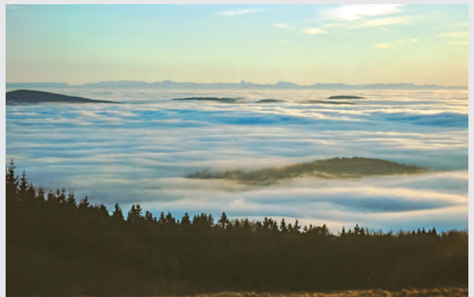
Abb. 16: Alpenpanorama vom Oberfrauenwald.