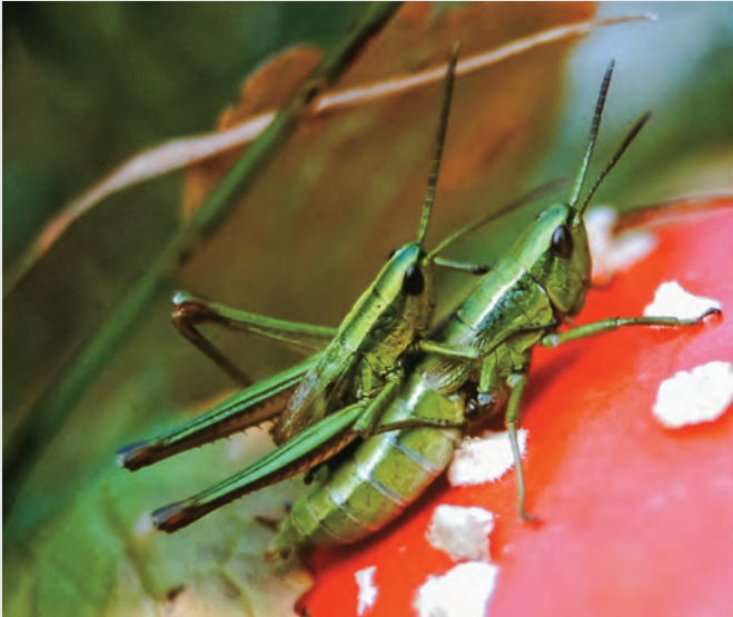
Abb. 7: Pärchen der Kleinen Goldschrecke ( Chrysochraon brachyptera ) auf einem Fliegenpilz.