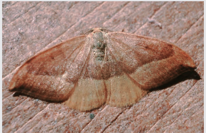
Abb. 10: Buchen-Sichelflügler ( Watsonalla cultraria )