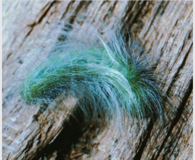
Abb. 8: Raupe der Woll-Rindeneule ( Acrionicta leporina ).