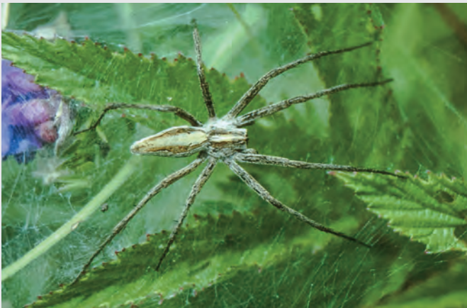
Abb. 9: Listspinne ( Pisaura mirabilis ).