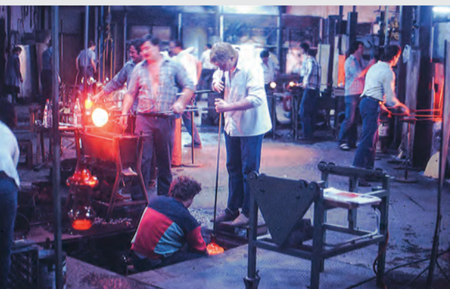
Abb. 19: Glashütte Theresiental 1988.