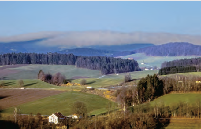
Abb. 15: „Wind-Haubn“ von Böhmen her.