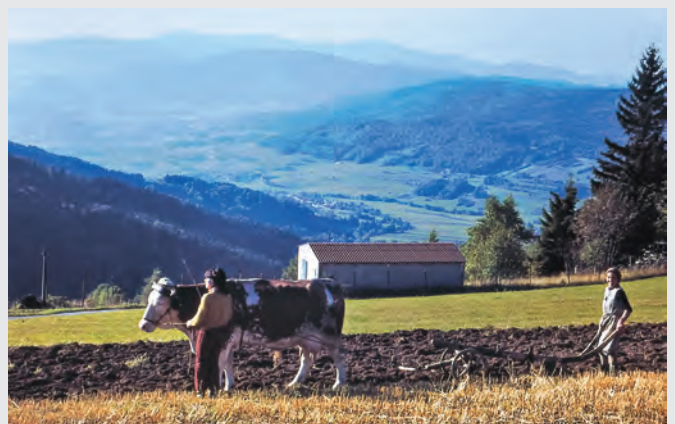
Abb. 18: Szene bei Langfurth (ohne Jahreszahl).