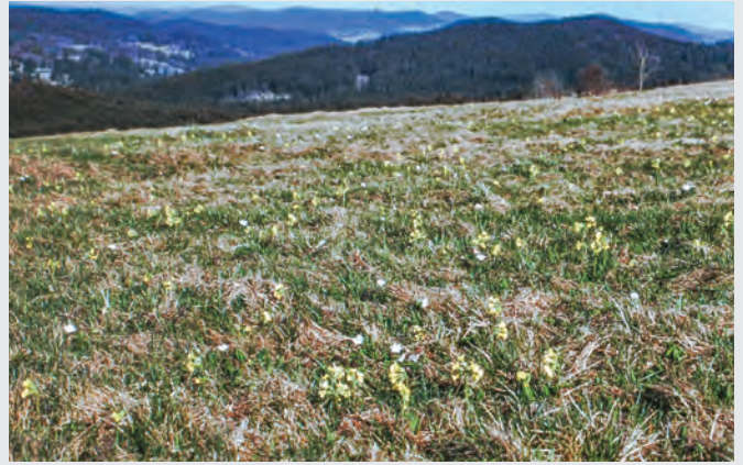
Abb. 14: Frühling in Mitterfirmiansreut.