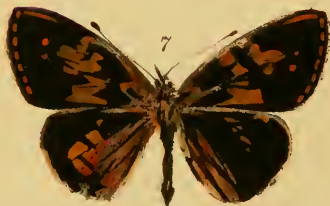
1. Colias Hyale . Aberratio.