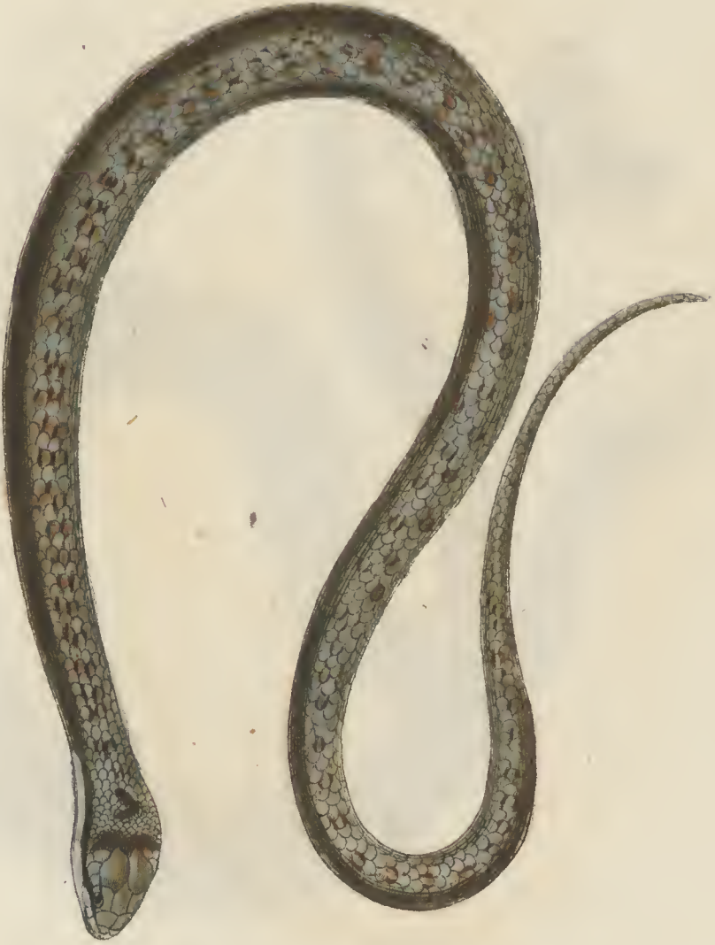
Coluber agrestis L. b.