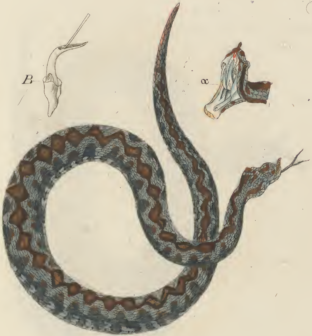
Coluber Ammodytes Mas L. a.