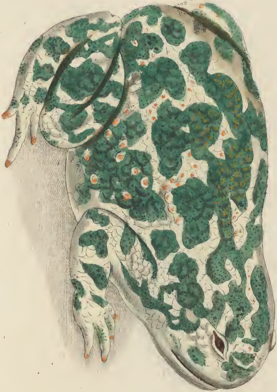
Rana variabilis Pull. 6.