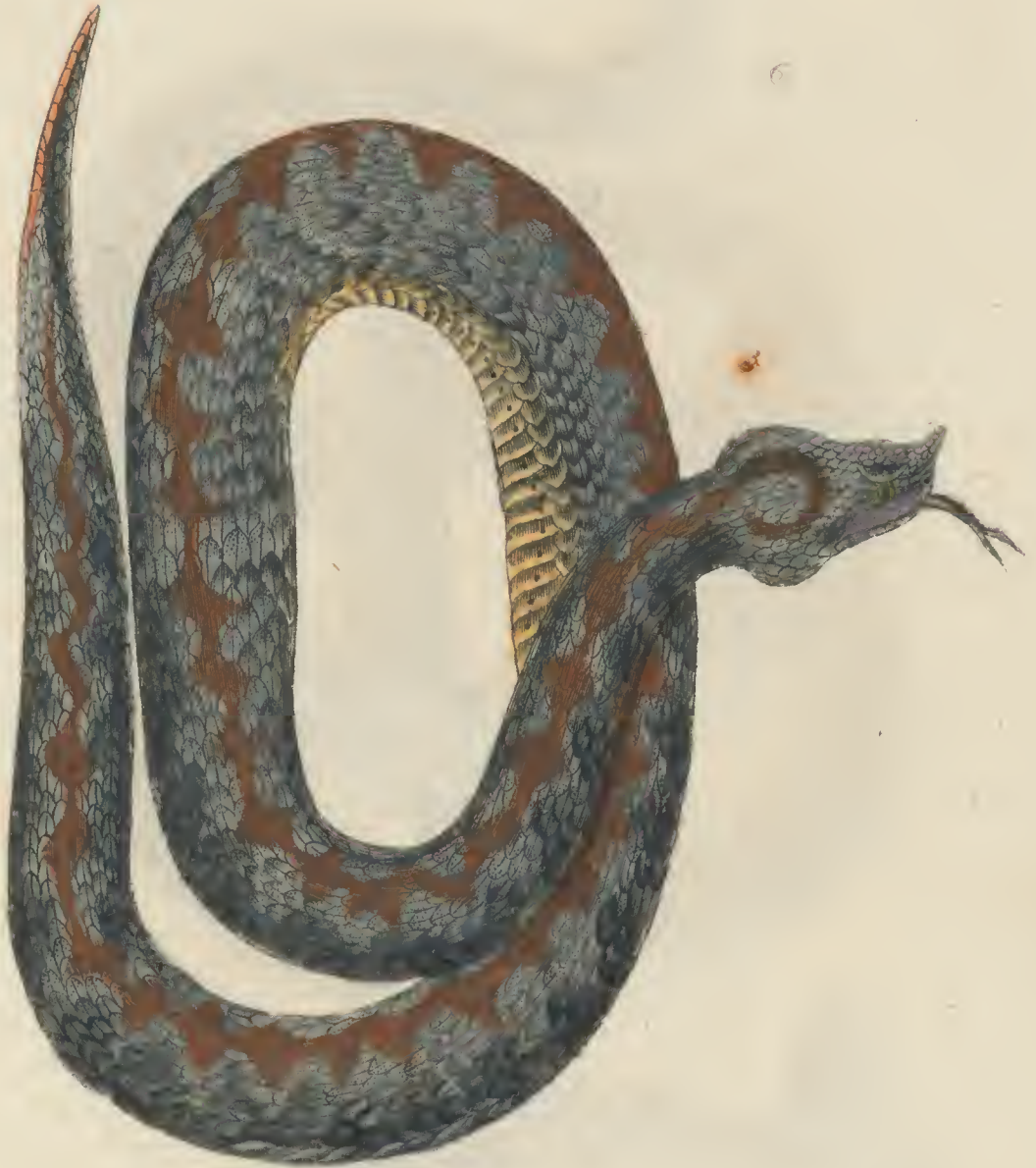
Coluber Ammodytes Fem. L. b.