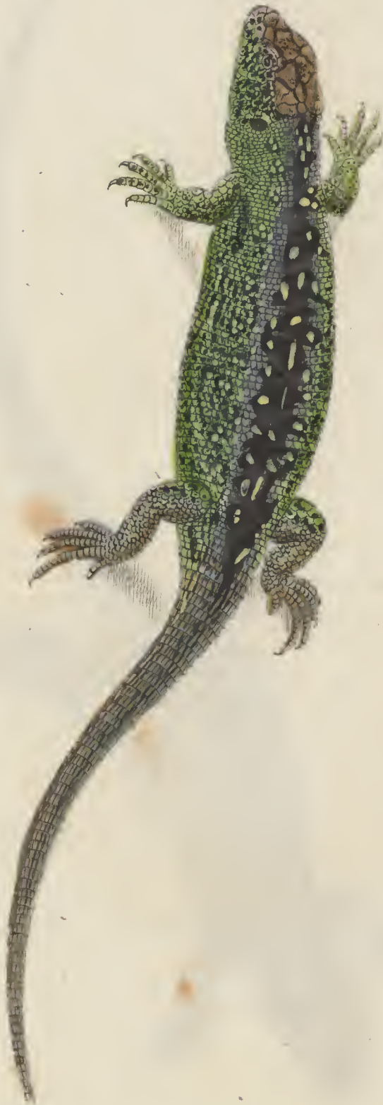
Lacerta agilis Mas L.