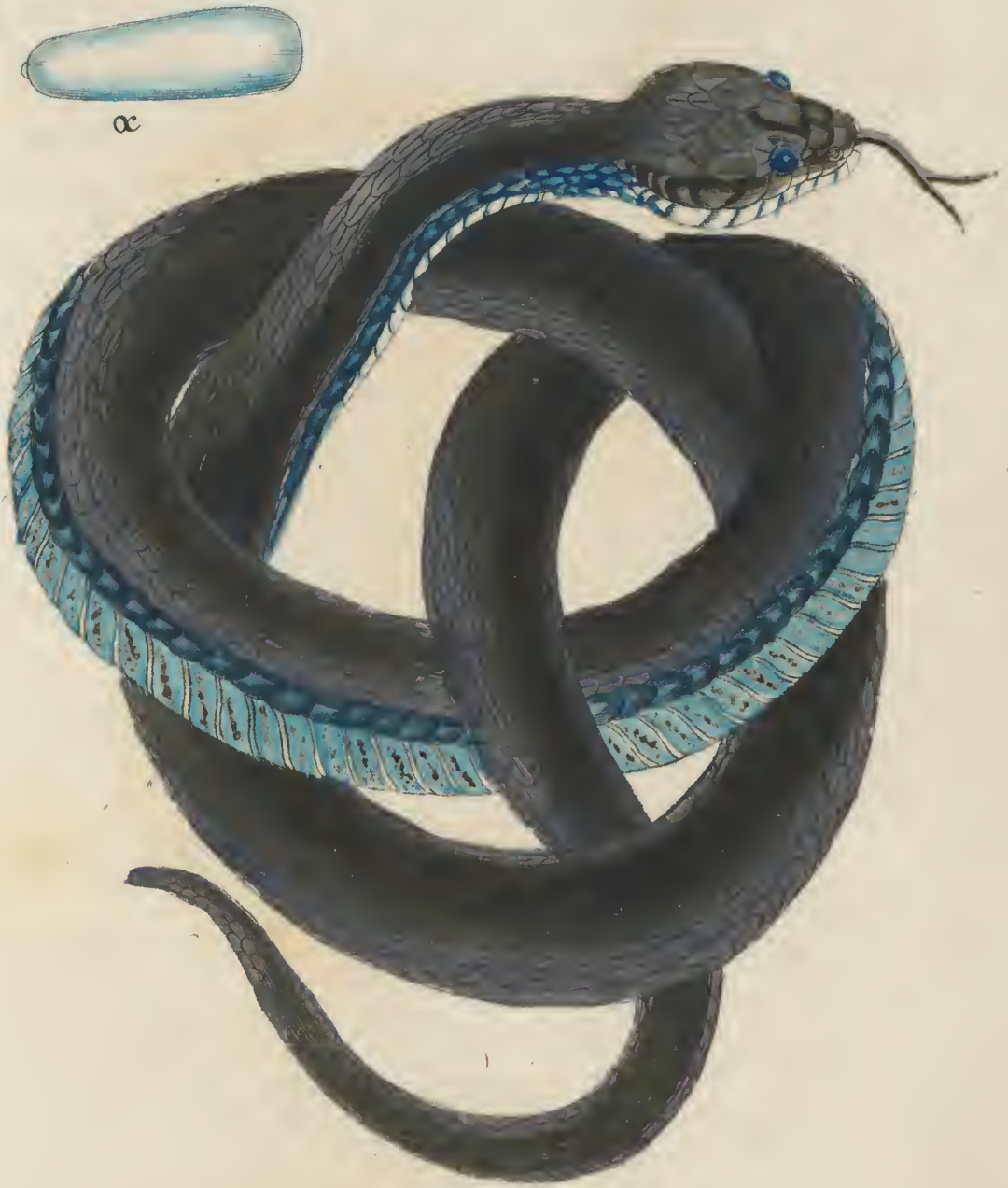
Coluber Aesculapii Fem. L. b.