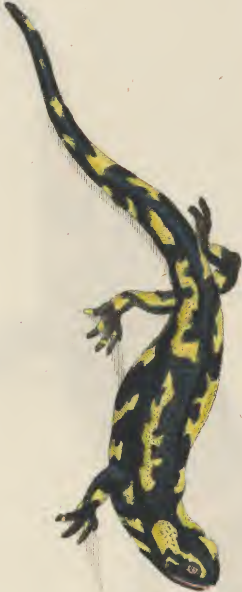
Lacerta Salamandra L.