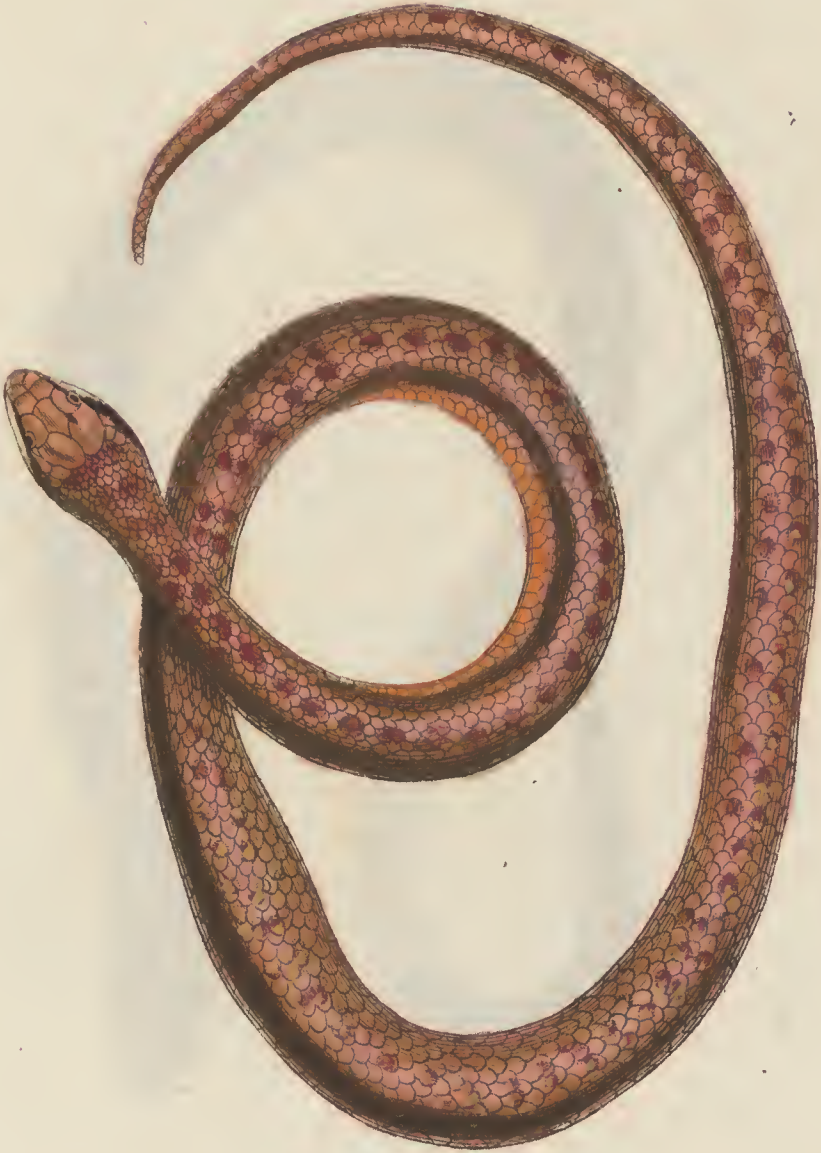
Coluber austriacus L.