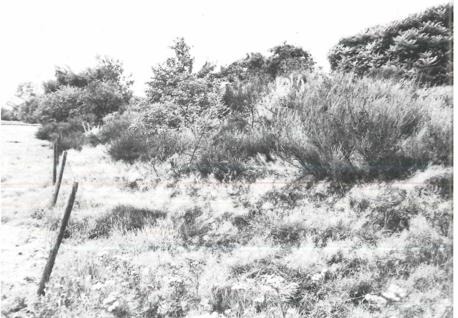
Abb. 6 Mengeder Heide Sonnenexponierte Trockenrasenböschung. Bis 1975 optimaler Lebensraum der Zauneidechse, heute hier ausgestorben.