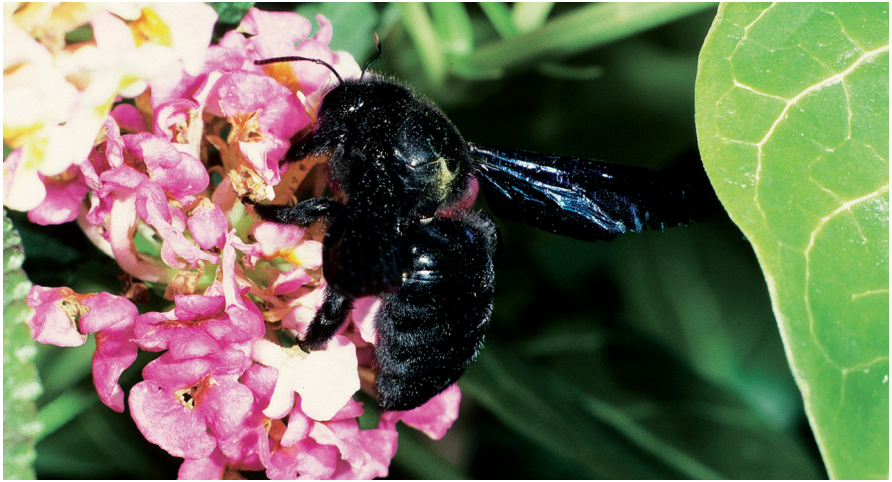
Abb. 1: Xylocopa violacea -♂ bei der Nektaraufnahme.