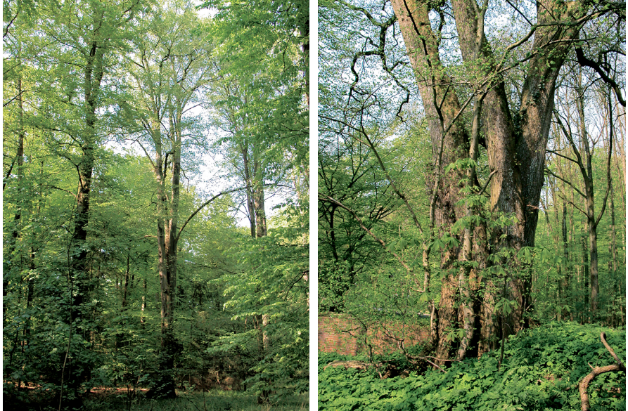
Abb. 2: Auf geeigneten Standorten des Östlichen Hügellandes Schleswig-Holsteins erreichen Flatterulmen nicht selten Höhen von über 40 m.

im Vergleich mit anderen Regionen sprechen. Nach MAYER (1992) erreicht die Flatterulme in der Regel nur Höhen von 15–20 m, jedoch auf „baltischen Lehmplatten“ 25–30 m. Laut SCHÜTT et al. (2002) wird sie „meist nicht über 25 m hoch“, maximal 35. Das Maximum setzen auch WALTER (1931) und HEGI (1957) bei 35 m an. Lediglich MÜLLER-KROEHLING (2003a) spricht von „35 m und mehr“. Letzterer betont wie MAYER und ebenso schon