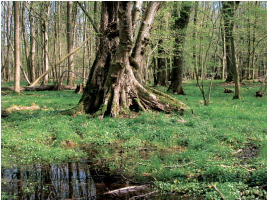
Abb. 5 (links oben): Die unten hohle Flatterulme ist nur noch durch ihre Brettwurzeln im nassen Boden verankert.