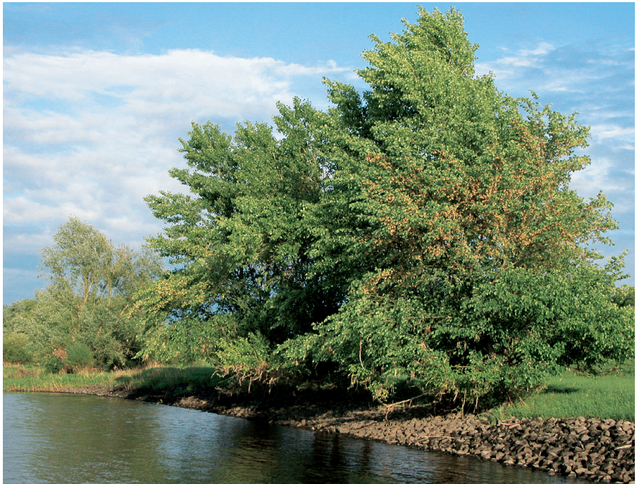
Abb. 4: Zusammen mit Weiden und Pappeln besiedelt die Flatterulme an der Elbe zwischen Schnackenburg und dem Elbholz die Oberkante der Uferbefestigung.