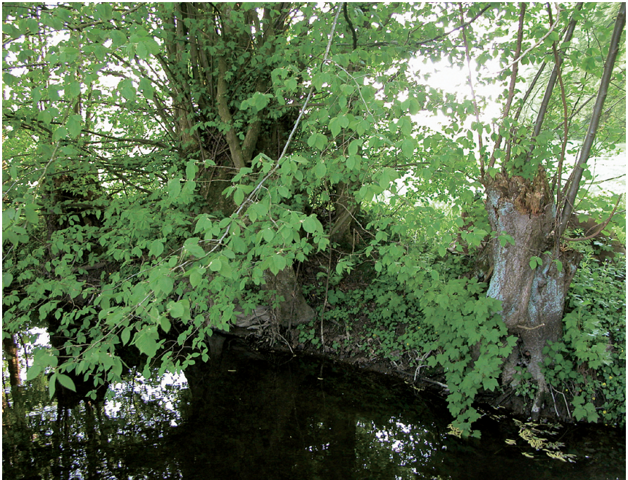
Abb. 9: Flatterulmen am Bachufer ragen mit ihren Wurzeln bis ins Wasser hinein und tragen so zur Uferbefestigung bei.

die Anzahl der für solche Projekte geeigneten heimischen Gehölzarten gering ist, sollte auf die Chance der Erhaltung der Vielfalt, die sich mit der Pflanzung der Flatterulme ergibt, verbunden mit den skizzierten übrigen günstigen ökologischen Wirkungen, nicht verzichtet werden.