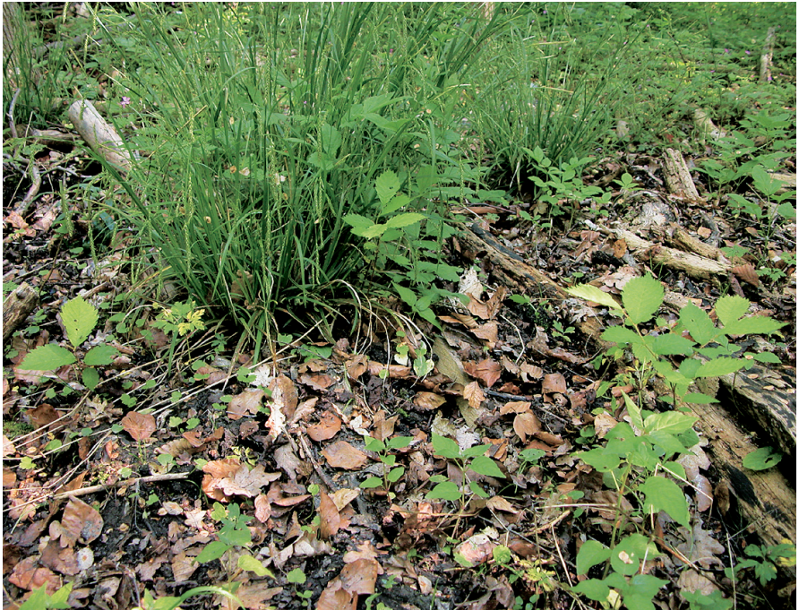
Abb. 8: Naturverjüngung auf unbedecktem Boden, der bis kurz vor dem Samenfall überflutet war.