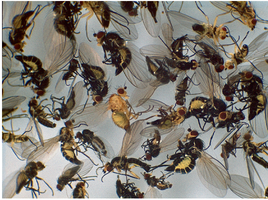
Abb. 2: (links) Agromyziden aus einer Kescherprobe von einer Wiese: Herbstaspekt.