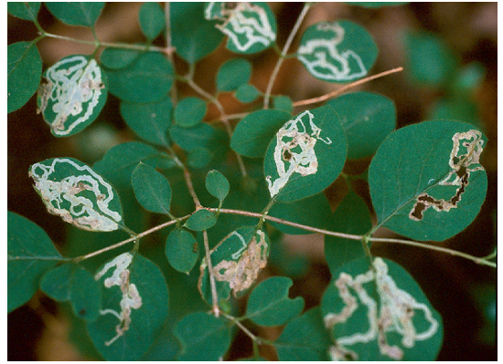
Abb. 3: (rechts) Blattminen einer Agromyzide ( Chromatomyia spec. ) an Lonicera spec.

[ Apodemus sylvaticus (L.)]. Die Insel beherbergt eine große Silbermöwenkolonie ( Larus argentatus PONT.). Besonders zur Zugzeit ist sie Rastplatz großer Vogelscharen. Viele nähere Einzelheiten zu Genese und zum anthropogenen Einfluss hat HÄESELER (1988) zusammengestellt. Beide Inseln kann man wegen ihrer geringen Größe und ganzjähriger Beherrschung durch Küstenvögel als naturbelassene „Vogelinseln“ bezeichnen, auf denen Sukzessionen natürlich ablaufen. Notwendigste Maßnahmen zum Küstenschutz haben auf die natürliche Dynamik des Sukzessionsgeschehens wenig Einfluss. Im dicht besiedelten Mitteleuropa kann man sich kein besseres Terrain für entomologische Forschungstätigkeit wünschen.