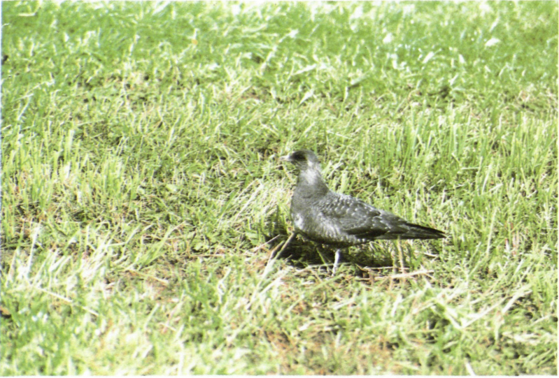
Abb. 5: Falkenraubmöwe ( Stercorarius longicaudus ), Steinbach a. Ziehberg/OÖ, September 1996. Fig 5: Long-tailed Skua.