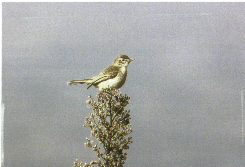
Abb. 7: Buschspötter ( Hippolais caligata ), Rheindelta/Vlbg, September 1997. Fig 7: Booted Warbler.