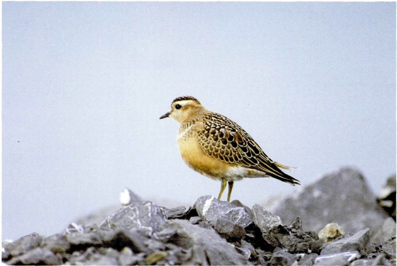
Abb. 3: Mornellregenpfeifer ( Eudromias morinellus ), Rheindelta/Vlbg, September 1998. Fig 3: Dotterel.