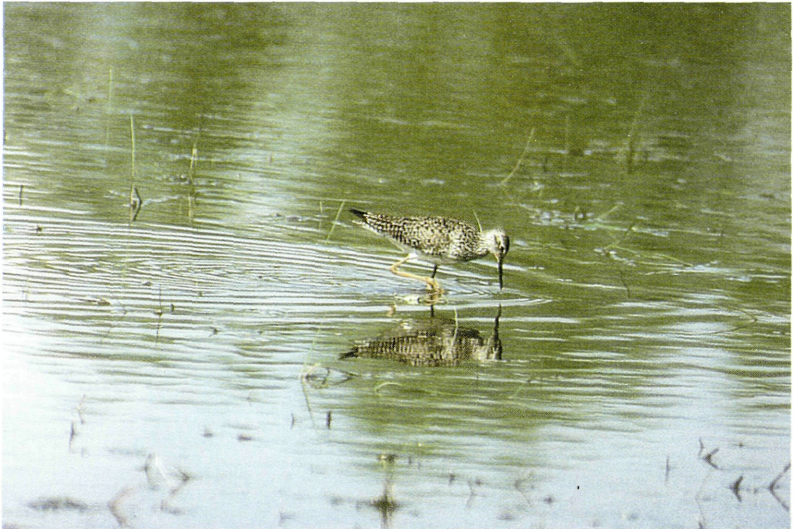
Abb. 4: Kleiner Gelbschenkel ( Tringa flavipes ), Podersdorf/Bgld, Mai 1997. Fig 4: Lesser Yellowlegs.