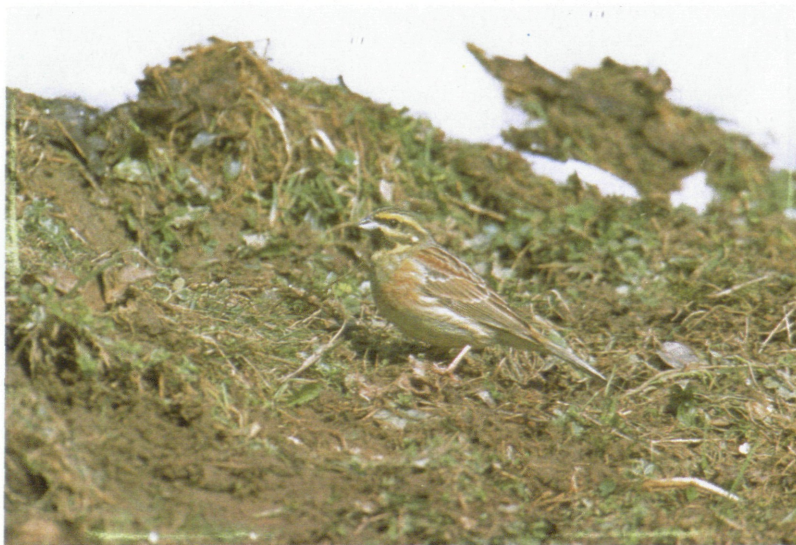
Abb. 8: Zaunammer ( Emberiza cirius ), Viechtwang/Almtal/OÖ, April 1996. Fig 8: Cirl Bunting.