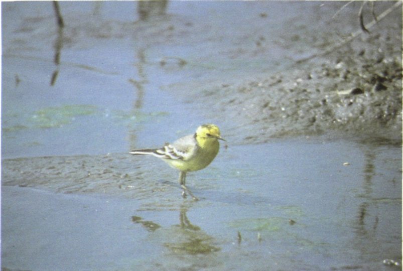
Abb. 6: Zitronenstelze ( Motacilla citreola ), Zurndorf/Bgld, Mai 1998. Fig 6: Citrine Wagtail.