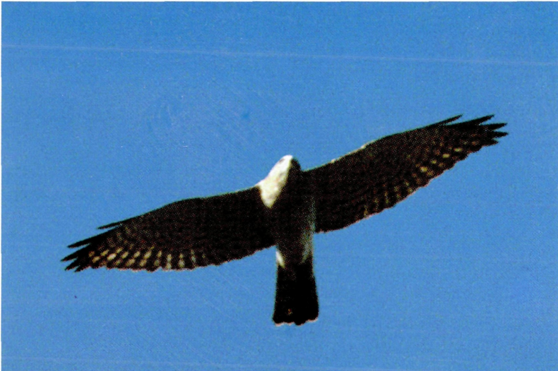
Abb. 2: Kurzfangsperber ( Accipiter brevipes ), Apetlon/Bgld, Mai 1997. Fig 2: Levant Sparrowhawk.