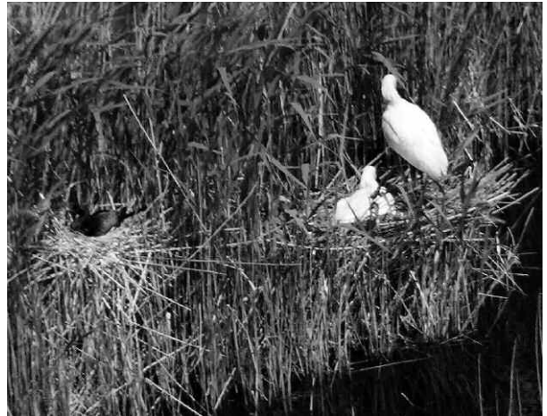
Abb. 1: Zwergscharbe am Nest am 8. Mai 2007, siehe zum Größenvergleich die beiden adulten Löffler rechts davon.

Im Untersuchungsjahr 2007 wurden bereits beim ersten von insgesamt fünf Flügen am 17. April 12 Nester der Zwergscharbe entdeckt. Sie lagen in unmittelbarer Nachbarschaft zu Silberreiher oder Löffler in einer großen Reiherkolonie, in der außerdem auch noch Graureiher und Seidenreiher ( Egretta garzetta ) brüteten (Abb. 1). Beim nächsten Flug am 8. Mai wurden noch zwei weitere Nester mit brütenden Altvögeln lokalisiert. An den folgenden Flugterminen am 18. Mai und 13. Juni konnten in acht Nestern 1–5 Junge identifiziert werden. Das Schicksal der anderen Nester konnte aufgrund eingeschränkter Sicht nicht geklärt werden. Zwergscharben brüten 27–30 Tage (Cramp & Simmons 1977), der Eiablagetermin am Neusiedler See fiel daher vermutlich in die zweite oder dritte Aprilwoche. Die erste Beobachtung von Zwergscharben im Gebiet gelang beim Seebad Illmütz am 6. April 2007 (E. Albecker, C. Neger, G. Spreitzer u.a., schriftl. Mitteilung der Avifaunistischen Kommission von A. Ranner). Die Vögel dürften daher kurz nach ihrer Ankunft am Neusiedler See mit dem Brutgeschäft begonnen haben. Überraschenderweise wurden am 28. Juli noch fünf weitere Nester mit sitzenden Altvögeln entdeckt. Sie befanden sich in unmittelbarer Nachbarschaft der mittlerweile schon verlassen anderen Neststandorte. Da Zwergscharben nur einmal pro Saison brüten (Cramp & Simmons 1977), handelt es sich bei diesen Nestern höchstwahrscheinlich um Ersatzbruten nach Brutaussfällen oder um Neuzugänge.