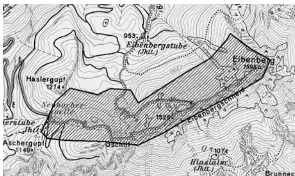
Abb. 2: Die Probestfläche Eibenberg bei Ebensee (Oberösterreich). Fig. 2: Study plot Eibenberg near Ebensee (Upper-Austria).

Der Eibenberg (1.598 m) ist ein markanter, bewaldeter Bergrücken südlich des Traunsees (Salzkammergut) und wird zu den Kalkvoralpen gezählt (Abb. 2). Das Gebiet ist sehr niederschlagsreich (ca. 1.500 mm Jahresniederschlag, Auer et al. 1998). Die dominante Baumart in tieferen Lagen ist die Buche, ab ca. 1.000 m wird sie von Tannen und Fichten abgelöst und ab ca. 1.300 m kommt die Fichte in Reinbeständen vor.