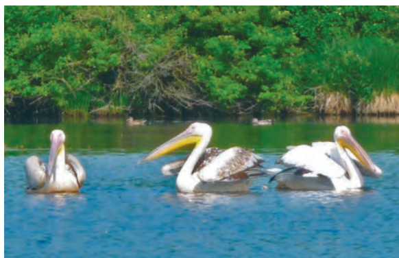
Abb. 2: Rosapelikane, Strußnigteich/Ktn, Mai 2009 Fig. 2: White Pelicans, Strußnigteich (Carinthia), May 2009