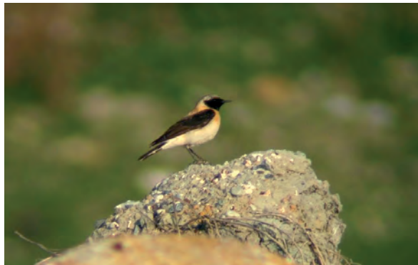
Abb. 13: Mittelmeersteinschmätzer, Voitsberg/Stmk, April 2007 Fig. 13: Black-eared Wheatear, Voitsberg (Styria), April 2007