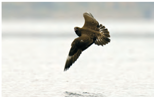
Abb. 7: Spatelraubmöwe, Traunsee/OÖ, Oktober 2007 Fig. 7: Pomarine Skua, Traunsee (Upper Austria), October 2007