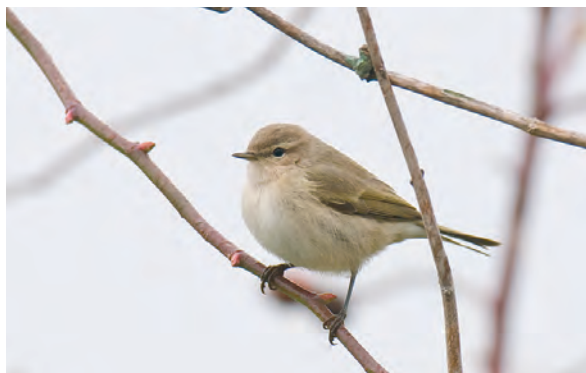
Abb. 15: Taigazilpzalp, Illmitz/Bgld, November 2009 Fig. 15: Siberian Chiffchaff, Illmitz (Burgenland), November 2009