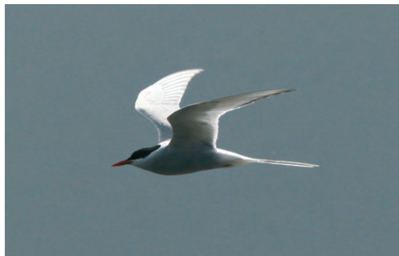
Abb. 10: Küstenseeschwalbe, Wasserstetten Illmitz/Bgld, Mai 2009 Fig. 10: Arctic Tern, Wasserstetten Illmitz (Burgenland), May 2009