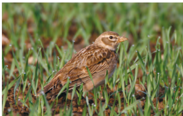
Abb. 11: Kalanderlerche, Kappel a. Krappfeld/Ktn, April 2008 Fig. 11: Calandra Lark, Kappel a. Krappfeld (Carinthia), April 2008