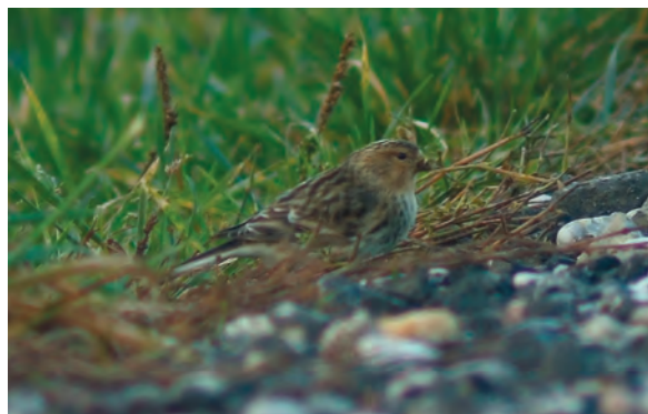
Abb. 16: Berghänfling, Hargelsberg/OÖ, November 2007 Fig. 16: Twite, Hargelsberg (Upper Austria), November 2007