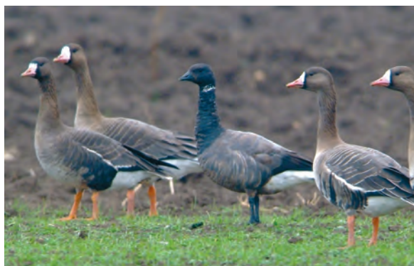
Abb. 4: Ringelgans, St. Andrä/Seewinkel/Bgld, Februar 2007 Fig. 4: Dark-bellied Brent Goose, St. Andrä, Lake Neusiedl, February 2007