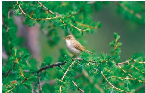
Abb. 14: Grünlaubsänger, Loigistal/OÖ, Juni 2008 Fig. 14: Greenish Warbler, Loigistal (Upper Austria), Juni 2008