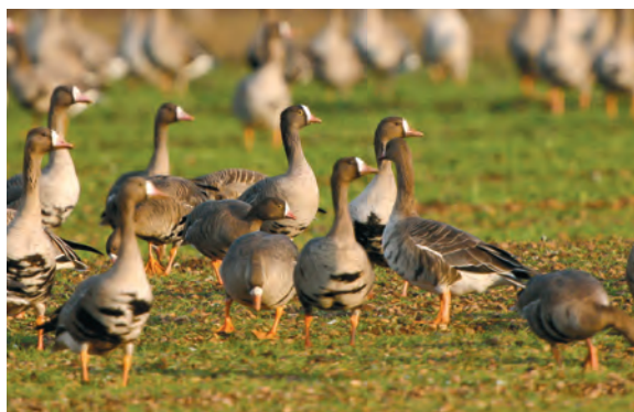
Abb. 3: Zwerggänse, St. Andrä/Seewinkel/Bgld, Dezember 2008 Fig. 3: Lesser White-fronted Geese, St. Andrä, Lake Neusiedl, Dec. 2008