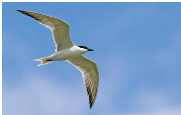
Abb. 9: Lachseeschwalbe, Hainfelder Teich/Stmk, Mai 2007 Fig. 9: Gull-billed Tern, Hainfelder Teich (Styria), May 2007