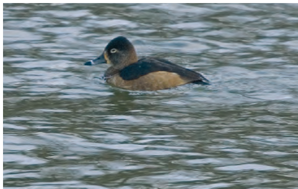
Abb. 5: Ringschnabelente, Untere Neue Donau/W, Jänner 2008 Fig. 5: Ring-necked Duck, Danube, January 2008