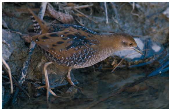
Abb. 6: Zwergsumpfhuhn, Kirchberg a.d. Raab/Stmk, Oktober 2008 Fig. 6: Baillon's Crake, Kirchberg a.d. Raab (Syria), October 2008