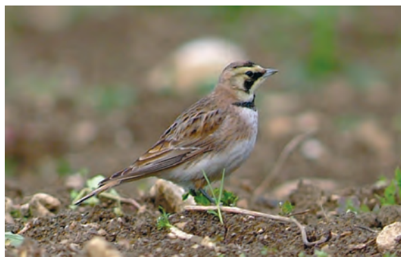
Abb. 12: Ohrenlerche, Micheldorf/OÖ, April 2008 Fig. 12: Shore Lark, Micheldorf (Upper Austria), April 2008