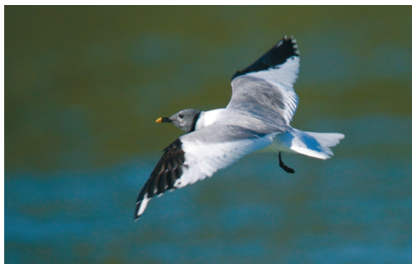
Abb. 8: Schwalbenmöwe, Innstausee Obernberg/OÖ, Oktober 2008 Fig. 8: Sabine's Gull, Innstausee Obernberg (Upper Austria), October 2008