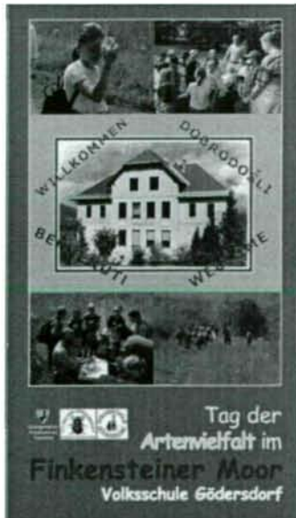
Abb. 2: Titelseite der Broschüre “Tag der Artenvielfalt im Finkensteiner Moor, Volksschule Gödersdorf”.

Die Kinder waren mit großer Begeisterung bei der Sache (Abb. 3). Insgesamt wurden an diesem Tag, unter der Mithilfe einer Reihe von Fachleuten, 337 Arten festgestellt – davon 193 Insekten- und Arachnidenarten. In der Artenliste, abruf-