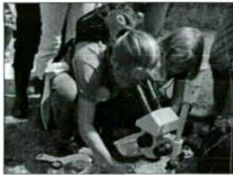
Abb. 1: Ein Ziel des Aktionstages: „Tiefe“ Einblicke in die Welt der Sechsen- und Achtbeiner.

Initiiert und koordiniert von der Zeitschrift GEO fand, wie schon in den vergangenen zwei Jahren, auch heuer wieder ein “Tag der Artenvielfalt” statt. Von dieser Idee begeistert, entschlossen sich die Mitglieder des Lehrerkollegiums der Volksschule Gödersdorf (Marktgemeinde Finkenstein a. Faakersee) dazu, mit ihren Schülern am Biodiversitätstag teilzunehmen. Als “Projektgebiet” wurde das unweit der Schule gelegene Naturschutzgebiet Finkensteiner Moor ausgewählt. Mehrere Wochen vor dem Aktionstag