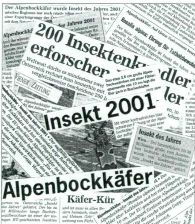
Abb. 4: Beispiele der zirka 60 Zeitungsmeldungen über Österreichs Insekt des Jahres 2001: Rosalia alpina .

Überraschend positiv entwickelte sich ein Unterstützungsansuchen an das Bundesministerium für Land- und Forstwirtschaft, Umwelt- und Wasserwirtschaft , das innerhalb weniger Tage mit einer Förderungszusage in der Höhe von ATS 100.000,- zur Folge hatte. Entomologie und Naturschutz fanden mit einer Altholz bewohnenden Cerambycide rasch potente Partner, und zwar nicht nur Geldgeber für ein Poster, sondern auch für die praktische Umsetzung von Naturschutzprojekten. Wesentlich war dem Ministerium die Zusage, über einen geeigneten Verteilerkreis zu verfügen: Dabei sind wir auf den Österreichischen Naturschutzbund angewiesen, der mit einer eigenen Zeitschrift ("Natur & Land") auch über eine entsprechende Klientel verfügt. 50.000 Poster von R. alpina samt Fotos von sonstigen EU-relevanten xylobionten Koleopteren wurden gedruckt und vor allem an alle Schulen Österreichs verschickt – die bisher aufwendigste PR-Aktion für ein Insekt in Österreich! Hauptproblem bei derartigen Massensendungen ist das Porto, das nur mit Sonderkonditionen (Poster als Sonderheft einer bestehenden Zeitschrift) finanzierbar bleibt.