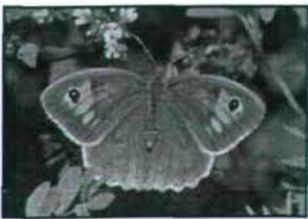
Abb. 1: Maniola jurtina (Weibchen).

Endemische Arten sind ein zentraler Schwerpunkt der Naturschutzbiologie, da ein Verschwinden aus ihrem sehr begrenzten Verbreitungsgebiet ihr vollkommenes Aussterben bedeuten würde. Sie sind außerdem das Ergebnis besonderer (a)biotischer Bedingungen und Indikatoren für besondere, seltene Artengemeinschaften, deren Erhaltung im