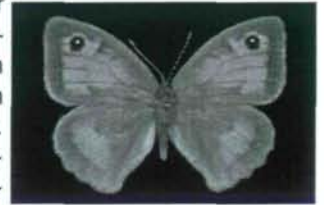
Abb. 2: Maniola nurag (Weibchen).

Allelfrequenzen, die jedoch auch zwischen Insel und Kontinent niedrig waren. Sowohl genetische Variabilität als auch der Anteil an Heterozygoten waren in allen untersuchten Populationen hoch. Die der Protein-clock-Hypothese folgende Berechnung von Divergenzzeiten aus genetischen Distanzen ergab je nach Kalibrierung Schätzungen von 1-5 Millionen Jahren seit der Trennung der beiden Arten. Demnach erfolgte die Trennung der sardinischen Linie nach der Abdriftung der sardo-korsischen Platte von der kontinentalen Landmasse (vor ca. 19 Mio. Jahren) und nach der Austrocknung des Mittelmeers (5-5,5 Mio. Jahre). Genfrequenzen lassen auf Genfluss zwischen den Populationen schließen. Obwohl alle Maniola -Arten relativ sedentär sind, zeigen die Ergebnisse dieser Studie eine Verbindung der Populationen durch gelegentliche Migration. Ungefähr 4% der Individuen bewegen sich zwischen mehr als 200 m voneinander entfernten Habitattteilen (Abb. 3).