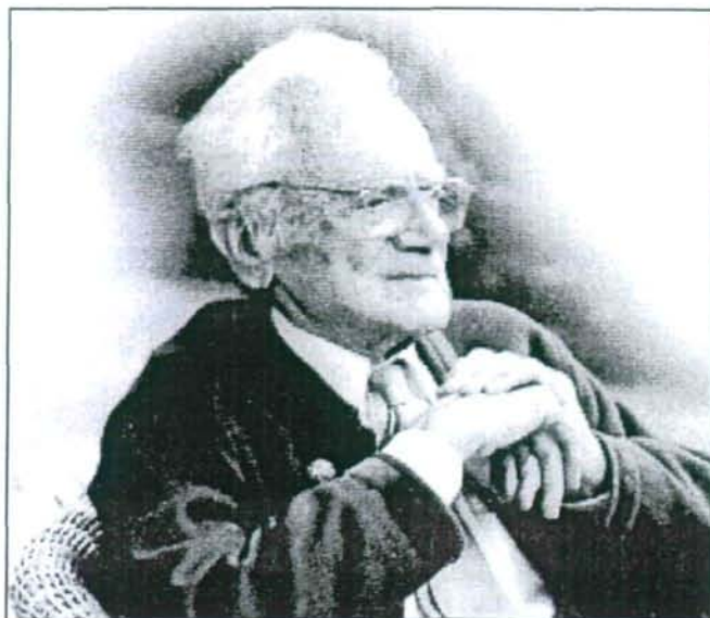
Abbildung 1: Karl von Frisch, der Doyen der Bienenforschung in Graz.

Karl von Frisch entstammt, 1886 geboren, einem akademischen Umfeld. Sowohl sein Vater als auch sein Großvater mütterlicherseits waren Universitätsprofessoren. Das geistige Klima, in dem er aufwuchs, war aber nicht nur wissenschaftlich sondern auch kulturell sehr stark geprägt, zählten zum Freundeskreis der Familie Menschen wie Marie von Ebner-Eschenbach, Theodor Billroth, Hans Hass und Karl Heinrich Waggenerl. Zwar spielte Karl von Frisch auch Geige, aber schon die „Begleiter“ seiner Jugend vom Specht bis zum Sittich, und viele seiner Hobbys (vom Insektensammeln bis zur Begeisterung für Technik) wiesen auf die spätere Berufslaufbahn hin, die ihm bereits im Alter von 12 Jahren ziemlich konkret vorschwebte. „Du weißt gar nicht, wie gut du es hast – weil du weißt, was du werden sollst“, hat ihm einmal ein Freund in diesem Alter gesagt. Obwohl also sein