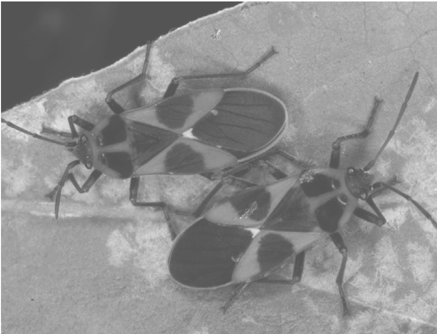
Abb. 1: Die Schwalbenwurzwanze Tropidothorax leucopterus lebt ausschließlich auf Schwalbenwurz. Am einzig bekannten Standort in Kärnten dürfte die Art vor kurzem ausgestorben sein. Eine zweifelsfreie Bestimmung über Fotobelege ist möglich.

Das alte Verzeichnis soll aktualisiert, z. T. revidiert und taxonomisch korrigiert werden. In einem weiterführenden Schritt soll die Erstellung einer entsprechenden Roten Liste die aktuelle Gefährdungssituation dieser Tiergruppe in Kärnten darstellen und Basis für künftige angewandt-naturschutzfachliche Betrachtungen sein.