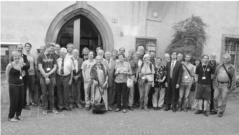
Abb. 1: Gruppenfoto der Tagungsteilnehmer am 10.09.2013 (mit Ausnahme jener, die gerade fotografieren).