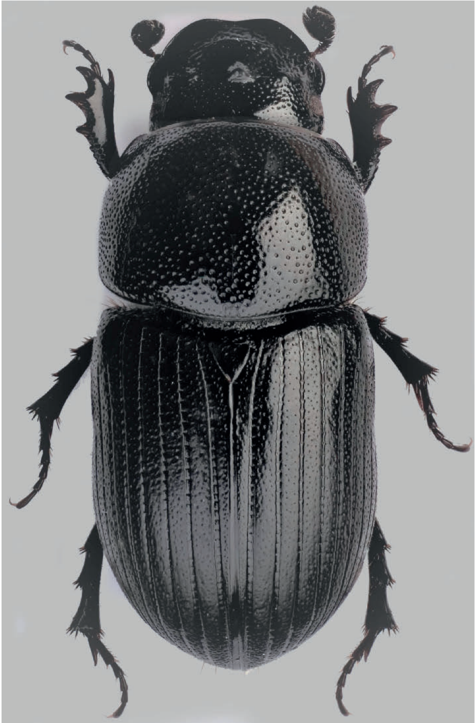
Abb. 2: Agrilinus convexus (Erichson), Männchen (Österreich, Niederösterreich, Kleinzell: Kleinzeller Hinteralm). Körperlänge: 5,2 mm.