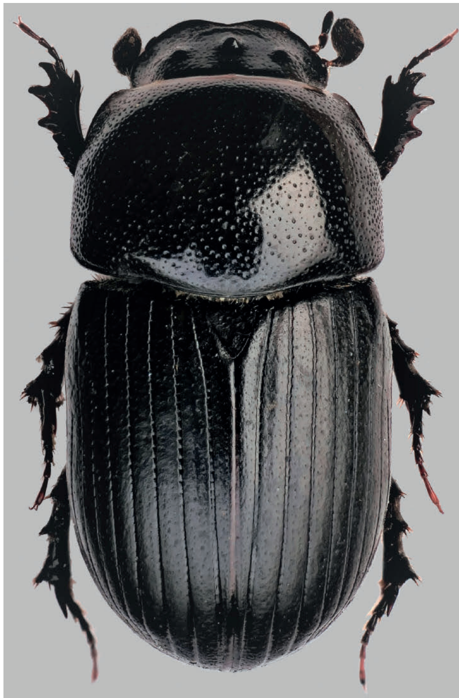
Abb. 1: Agrilinus ater (De Geer), Männchen (Deutschland, Thüringen, Gellershausen: Lachenkopf). Körperlänge: 5,8mm.