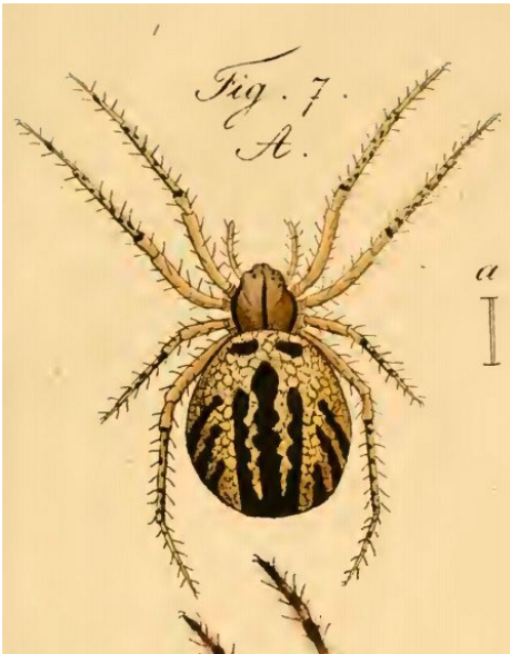
Abb. 3: Erste farbige Zeichnung eines Weibchens durch HAHN (1831) sub. Epeira genistae

Aufgrund des charakteristischen Zeichnungsmusters auf der Oberseite des Hinterleibs bestehend aus drei dunklen Streifen – genauer gesagt sind es drei Reihen schwarzer Punkte, die durch Längsstriche verbunden sind – kann die Streifenkreuzspinne in Mitteleuropa mit keiner anderen Radnetzspinne verwechselt werden. Und je nach Phantasie der Betrachter kann dieses Zeichnungsmuster mit seinen auffälligen schwarzen Streifen (daher der deutsche Populärname „Streifenkreuzspinne“, siehe BREITLING et al. 2020), die sich nach vorne hin vereinen, dem Ganzen die Form eines Kricketschlägers (Name in England: „cricket-bat orb-weaver“), oder einer kleinen Flasche (Name in Frankreich: „mangore petite bouteille“) verleihen. Auch der mitunter gemachte Vergleich mit einer Stimmgabel wäre zutreffend (Abb. 1 und 2).