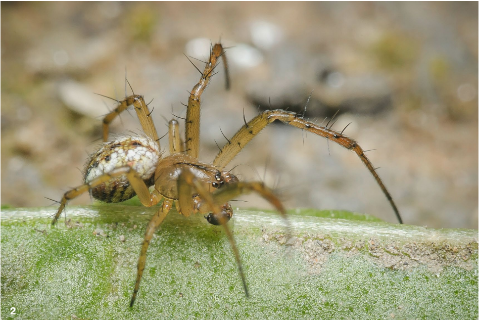
Abb. 1: Weibchen der Streifenkreuzspinne Mangora acalypha mit dem charakteristischen Zeichnungsmuster auf dem Hinterleib: Kricketschläger, Flasche oder Stimmgabel? Abb. 2: Männchen der Streifenkreuzspinne Mangora acalypha mit boxhandschuhartig vergrößertem Taster.