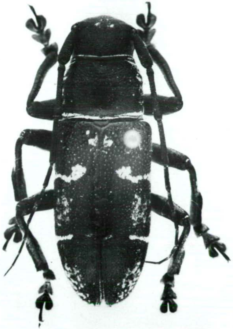
Abb.10: Pseudaprophata puncticornis (HELLER,1924 ) romblonica ssp.n., Holotypus ♂.