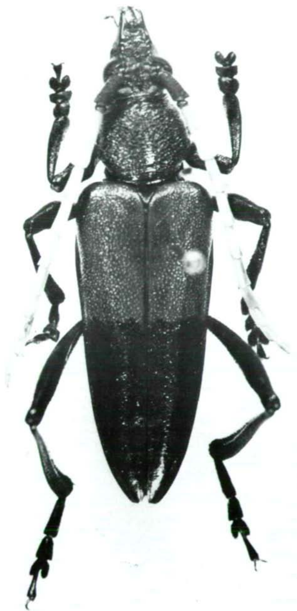
Abb.4: Pachyteria pseudoequestris sp.n., Holotypus ♂.