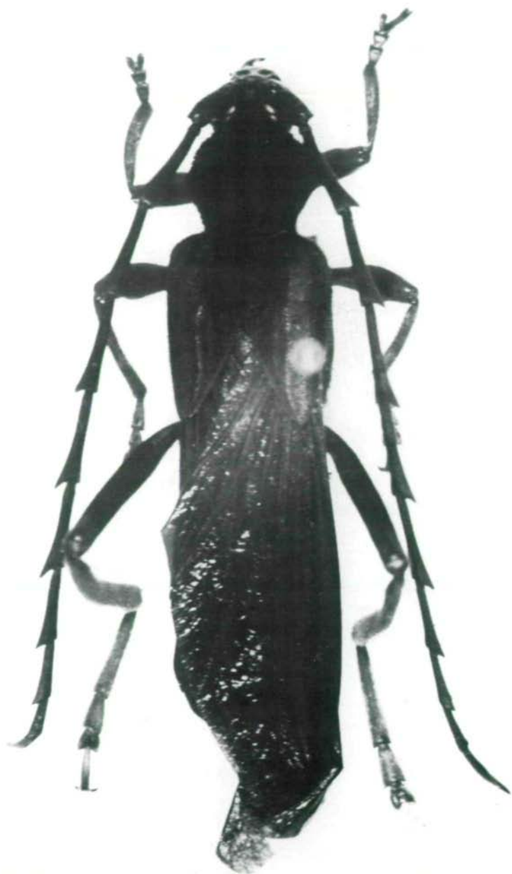
Abb.3: Coloborhombus ysmaeli sp.n., Holotypus ♂.