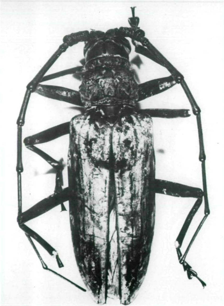
Abb.1: Neocerambyx paris (WIEDEMANN, 1821) luzonicus ssp. n., Holotypus ♂.