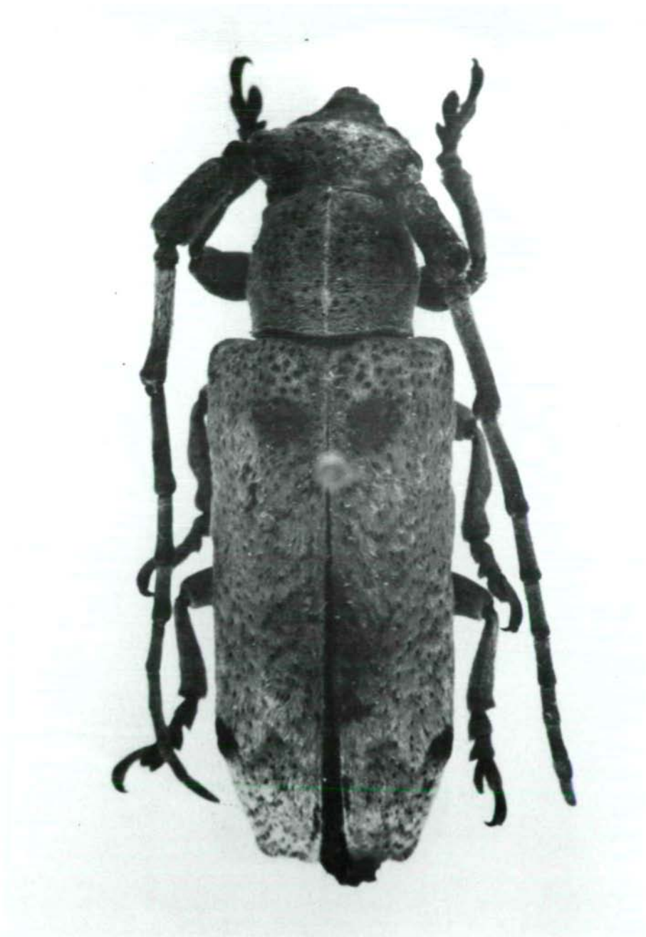
Abb.8: Aetholopus bimaculatus sp.n., Holotypus ♂.