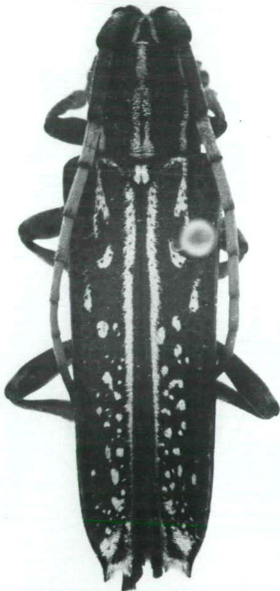
Abb.12: Glenea (Subgrossoglenea) wongi sp.n., Holotypus ♀.