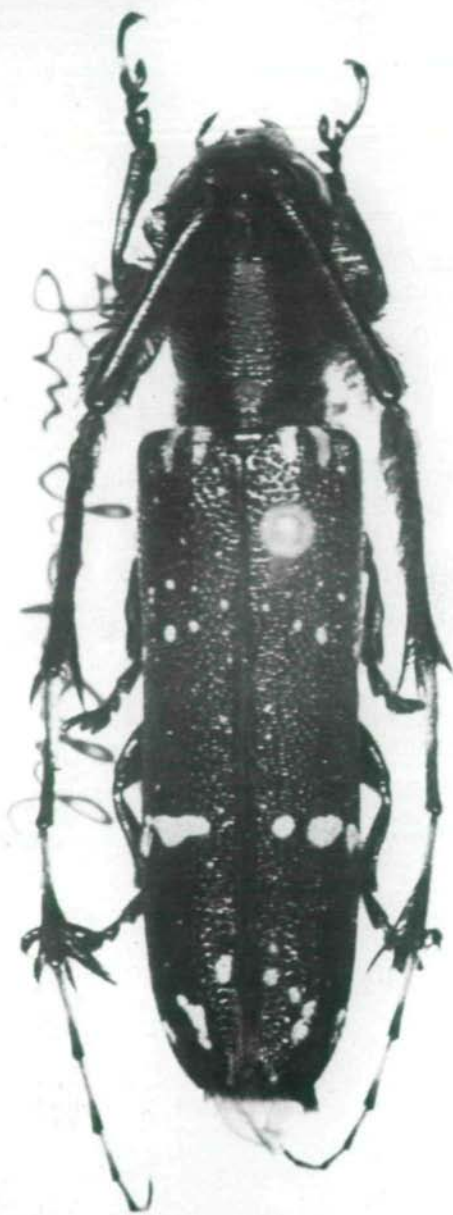
Abb.9: Aliboron wongi sp.n., Holotypus ♀.