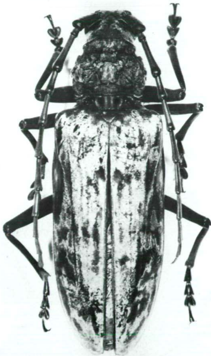
Abb.2: Neocerambyx parisi (WIEDEMANN,1821) luzonicus ssp. n., Paratypus ♀.