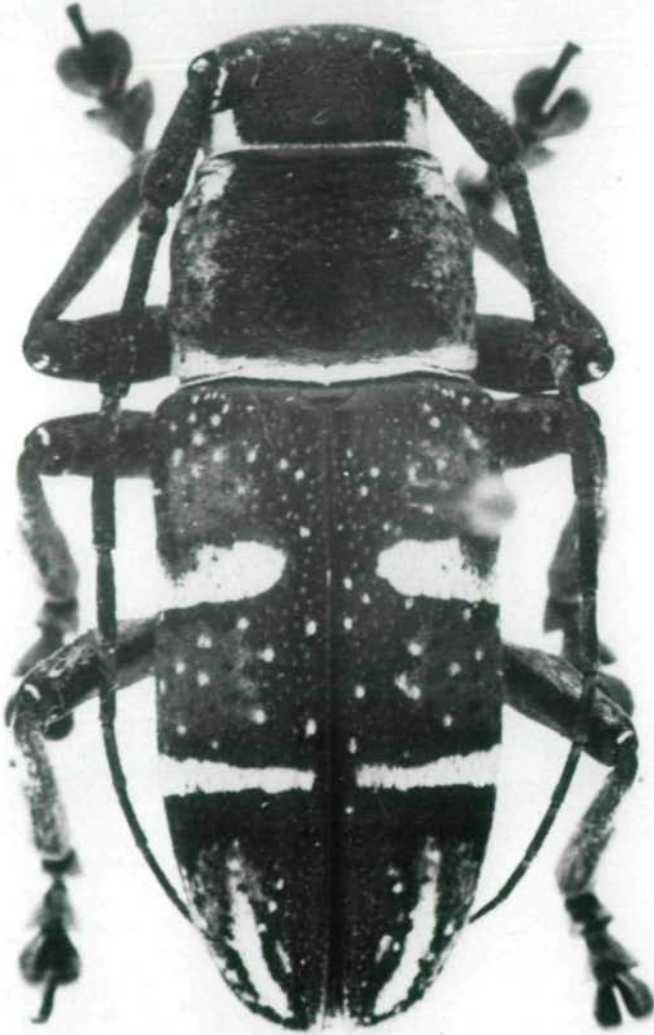
Abb.11: Pseudaprophata puncticornis (HELLER,1924) negrosiana ssp.n., Holotypus ♂.