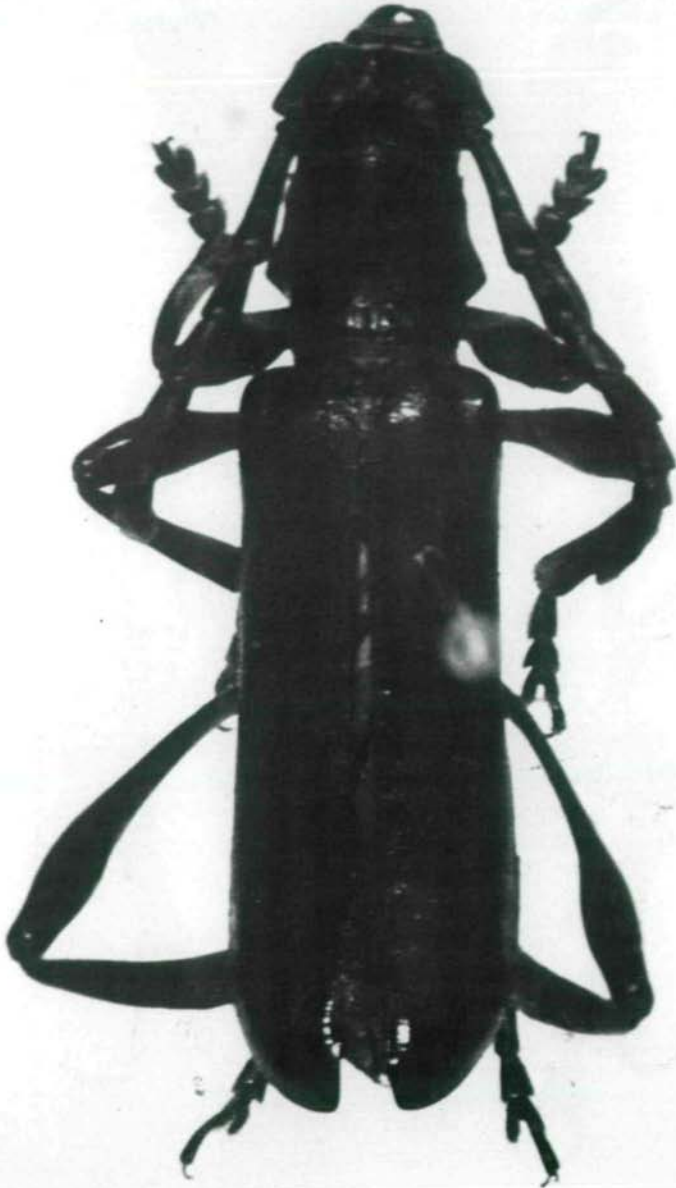
Abb.5: Ipothalia lumawigi sp.n., Holotypus ♂.