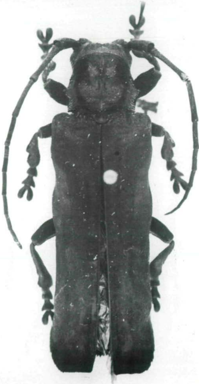
Abb.7: Thylactus sumatrensis sp.n., Holotypus ♀.