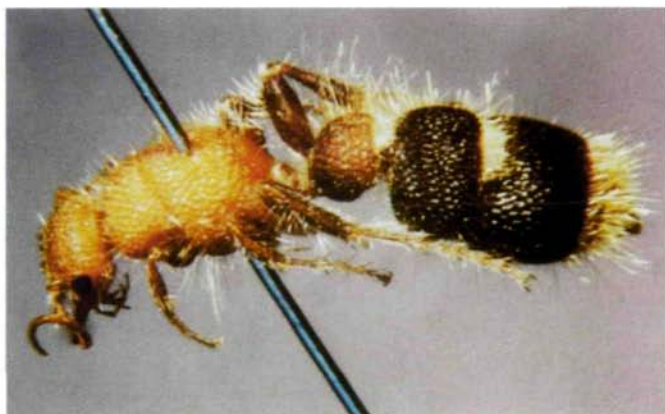
Abb. 1: ♀ von Apterogyna mlokosewitsi (10 mm)