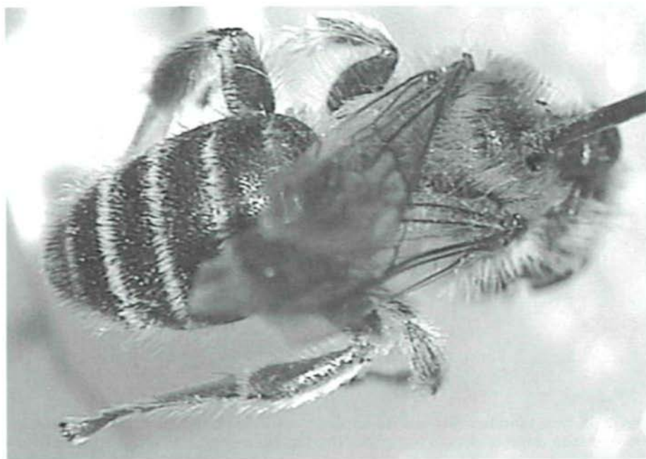
Fig. 1: Vista general dorsal del holotipo de Melitta hispanica .