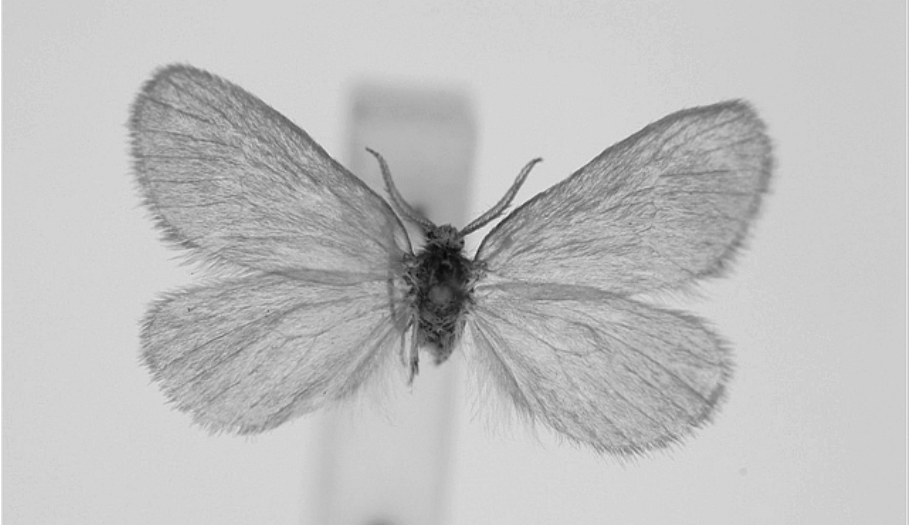
Abb. 1. Holotypus von Rebelia surientella BRUAND.