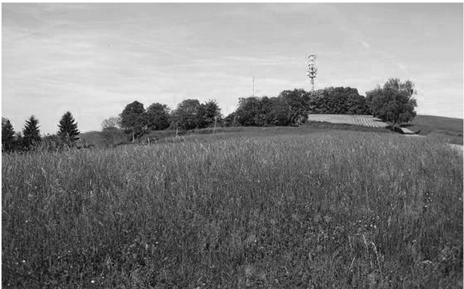
Abb. 4. Der Schutterlindenberg, locus typicus von Rebelia surientella , bei Lahr in Baden-Württemberg.