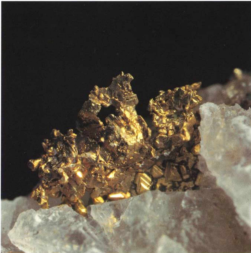
8 mm großes, dendritisches Aggregat von Goldkristallen, Slg.: Paar, Foto: Burgstaller, beide Uni Salzburg