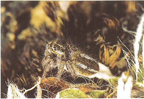
Abb. 2: Weibchen von Philaeus chrysops