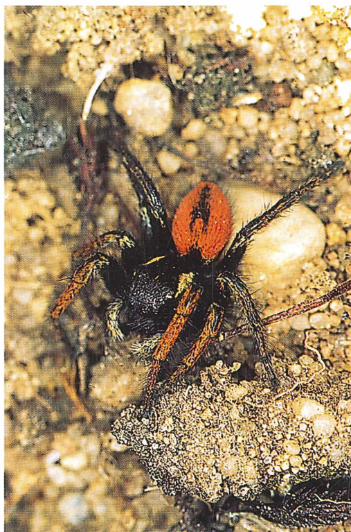
Abb. 1: Männchen von Philaeus chrysops am Lieberoser Fundort