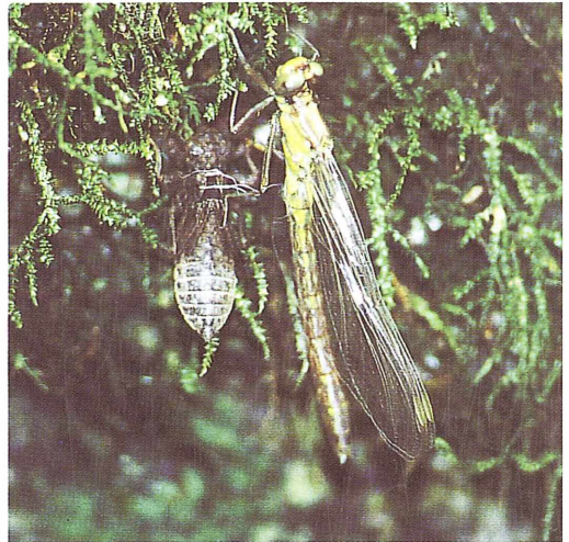
Abb. 3: Frisch geschlüpftes Männchen von Davidius aberrans neben der Exuvie auf einem bemoosten Stein einer Phytotelme in 2500 m ü. NN, 8.5.2000