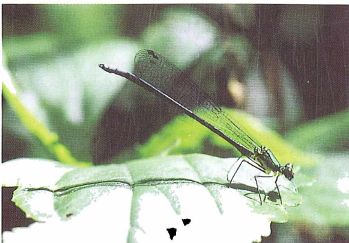
Abb. 1: Caliphaea confusa , Männchen, 8.5.2000

FRASER (1936) fand Exuvien von Anotogaster nipalensis an Binsen hängend in einem schmalen Bach, welcher durch einen Sumpf floß. Ähnliche Habitats gibt es im Gebiet an den unterhalb des Waldes liegenden Berghängen. Die Höhenverbreitung in Nepal wird mit 450 bis 3250 m ü. NN angegeben (VICK 1989). Die Art wurde bisher in Bangladesch, Indien, Nepal und China gefunden (TSUDA 1991).