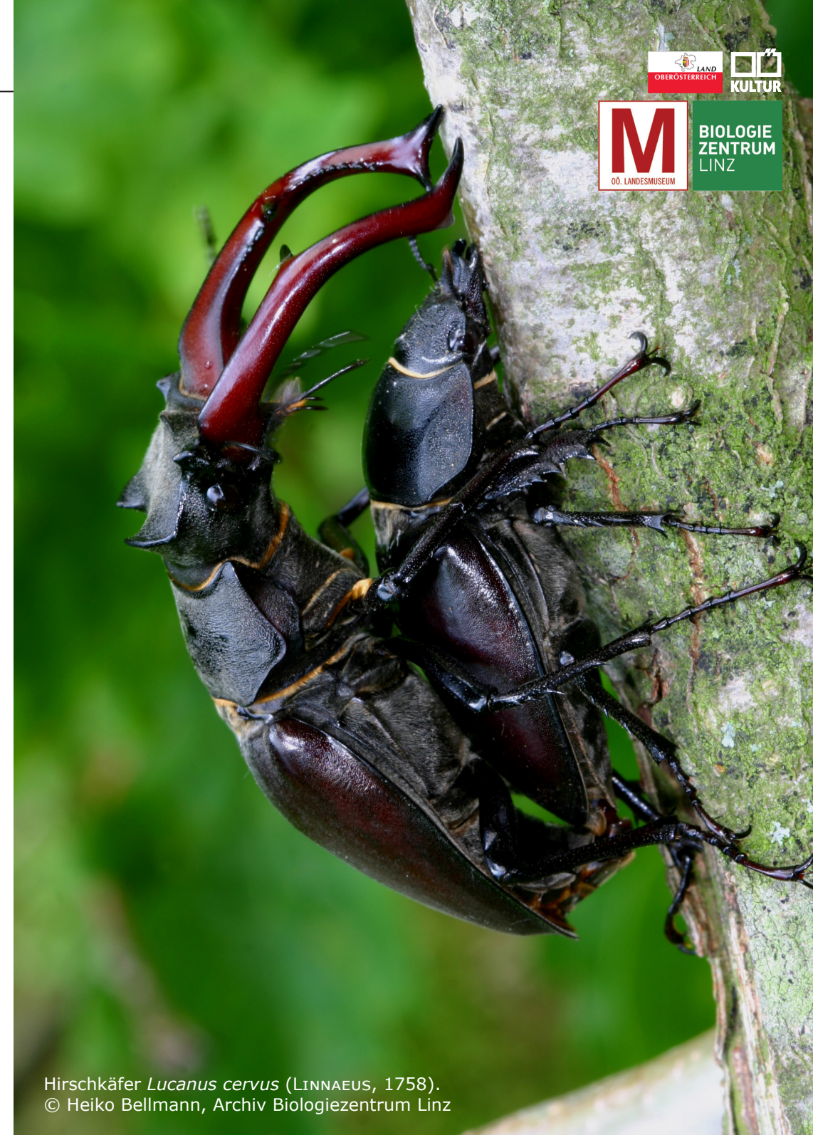
Hirschkäfer Lucanus cervus (LINNAEUS, 1758).