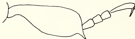
Abb. 2: Linke Hinterschiene von Cossonus tibialis n. spec. (schematisch).

Fühlerschaft lang, bis über die Mitte der Augen reichend, im letzten Drittel keulig erweitert, die Geißel fast so lang wie der Schaft, Glied 1 schwach konisch, doppelt so lang wie an der Spitze breit, Glied 2 stärker konisch, kaum länger als breit, 3–5 quer- 6 stark konisch, doppelt so breit wie lang, 7 etwa dreimal so breit wie lang, Keule lang eiförmig, zugespitzt, etwa so lang wie die Geißelglieder 2–7 zusammen, die Fühler glänzend, die Keule stark tomentartig behaart, matt, mit einigen längeren Börstchen besetzt.