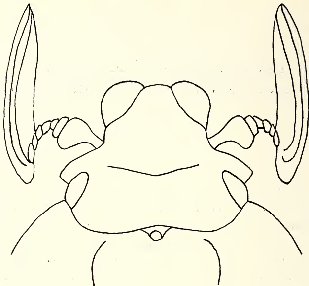
Abb. 1: Kopf von Teinogenys demarzi n. sp.

zweibuchtig, die Ausrandung bei der Fühlereinlenkungsstelle tiefer als jene hinter der Spitze. Augenkiele breit, mäßig lang, außen leicht gerundet, auch die Außenecke sehr stumpf. Von den Augen ist oben nur ein schmaler Teil zu sehen. Ein Stirnkiel ist nur schwach angedeutet, indem an dieser Stelle eine schwach eckige Linie etwas höher liegt. Die Mitte dieser Linie kann als die schwache Spur eines Tuberkels beurteilt werden. Die ganze Oberseite ist dicht gerunzelt, die Runzeln an der Stirn deutlich gröber als die am Clypeus. Die Mitte des Scheitels glatt, stark glänzend. Mandibeln, die Spitze des Clypeus leicht überragend, seitlich stark vorstehend, der Außenrand einfach gerundet, ohne Zähne. Fühler 10gliedrig, das 1. Glied sehr groß, kolbenförmig, so wie das viel kleinere 2. lang, mäßig dicht abstehend behaart. Das 2. und auch die weiteren Glieder der Geißel viel breiter als lang, besonders das letzte scheibenförmig schmal. Die 3 Fächerglieder stark verlängert, viel länger als alle übrigen Glieder zusammen und länger als der Kopf. Basis der Taster von der Kehlplatte nicht bedeckt, die Spitzenglieder schlank spindelförmig.